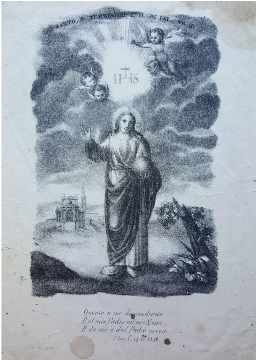
Fig. 1 Cristo Benedicente , sec. XIX, litografia, Falconara Marittima (AN), Biblioteca storico-francescana e picena, Fondo incisioni, class. 7, cassetto 31, n. 4. Iscrizioni in basso: "Lit. Gionantonj / in Ancona".