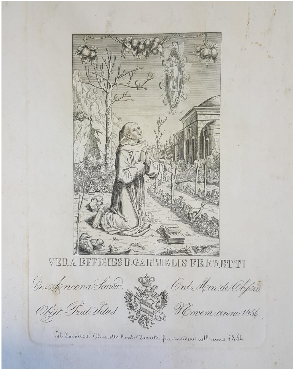
Fig. 3 Visione del Beato Gabriele Ferretti , 1856, incisione, Falconara Marittima (AN), Biblioteca storico-francescana e picena. Fondo incisioni, class. 7, cassetto 31, n. 4. Iscrizione in basso: "Vera effigies B. Gabriellis Ferretti / de Ancona Sacerd. Ord. Min.