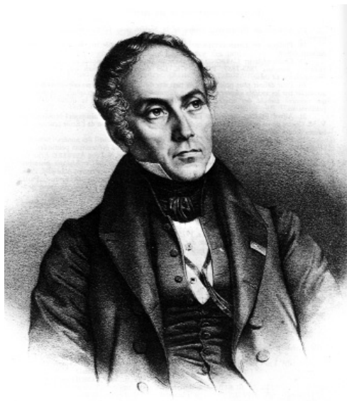
François Guizot, Litografia di Delpech su disegno di Mauvin, 1830.

Come ha sottolineato Lucien Jaume, questa critica della sovranità popolare ha come fine preventivo quello di «escludere dall'espressione pubblica le volontà cieche, ignoranti o supposte tali» (Jaume 1997, p. 126). La «sovranità della ragione» instancabilmente teorizzata da Guizot si risolve così in una «sovranità sociale organizzata» (Guizot 1863, Vol. III, p. 681), nella «legittimazione del dominio di fatto di coloro che posseggono l' intelligenza sociale » (Rosanvallon 1989, p. 424): sono infatti costoro a formare la "classe politica" per eccellenza, l' élite naturale chiamata a svolgere quel lavoro di autoriflessione sociale che costituisce lo specifico contenuto del sistema rappresentativo, un nesso funzionale nel quale il ruolo degli elettori risulta altrettanto rilevante di quello degli eletti 5 . Secondo Rosanvallon, la progressiva torsione in senso apertamente censitario che questa concezione avrebbe sperimentato nello sviluppo della vicenda politica francese non è che la conseguenza ultima delle difficoltà incontrate da una impostazione troppo astratta per essere resa adeguatamente operativa «in termini di codice elettorale» 6 . In realtà, già alla metà degli anni Venti la riflessione di Guizot sulla rappresentanza appariva dominata dalla tendenza