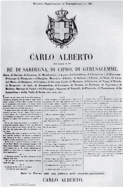
El Estatuto albertino (suppl. al "Risorgimento")

Imperio Otomano, Marruecos y los Estados Unidos de América. Las llamadas potencias del Norte, Austria, Prusia y Rusia, se abstuvieron. En la península italiana, la reina no fue reconocida ni por el reino de Piamonte-Cerdeña ni por el de las Dos Sicilias que mostraron sus preferencias por el infante don Carlos. Dicha oposición tuvo como fruto la petición de retirada del representante sardo y la ruptura formal de relaciones con Nápoles. La Santa Sede, a pesar de que la reina gobernadora había firmado un manifiesto, nada más fallecer su marido, en el que declaraba que «la religión y la monarquía, primeros elementos de vida para España, serán respetadas, protegidas