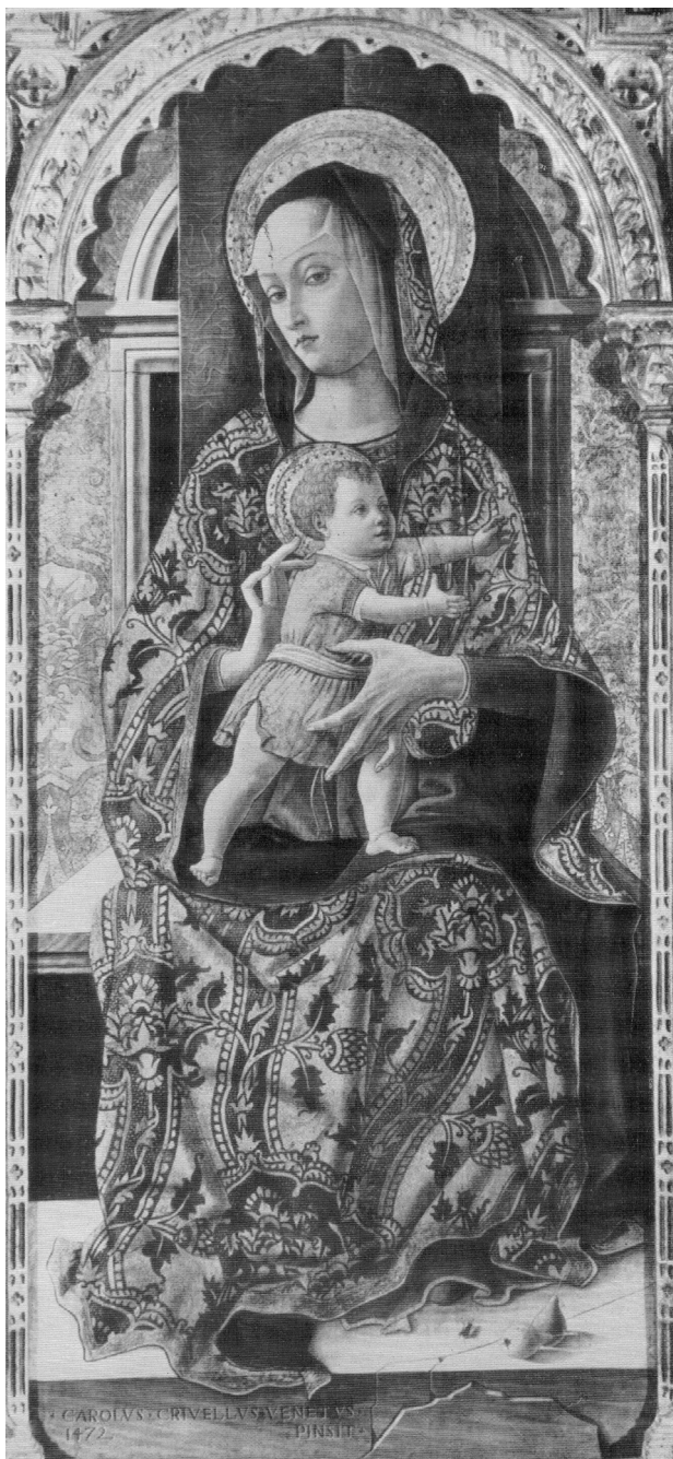
Fig. 14. Carlo Crivelli, Madonna in trono con il Bambino , scomparto centrale del polittico di Fermo, tavola firmata e datata CAROLVS+CRIVELLVS+VENETVS+ / 1472 PINSIT, proveniente dalla chiesa di san Domenico di Fermo, New York, Metropolitan Museum