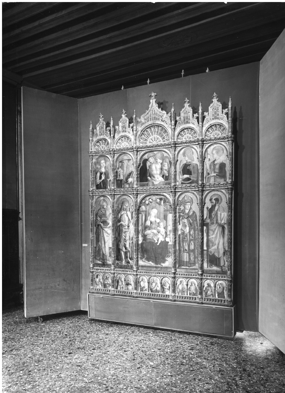
Fig. 12. Mostra "Carlo Crivelli e i crivelleschi", il polittico di Sant'Emidio (Venezia, Palazzo Ducale, 10 giugno – 10 ottobre 1961), allestimento di Egle Renata Trincolato, Venezia, Fondazione Giorgio Cini, Fototeca dell'Istituto di Storia dell'Arte, Fondo Pallucchini