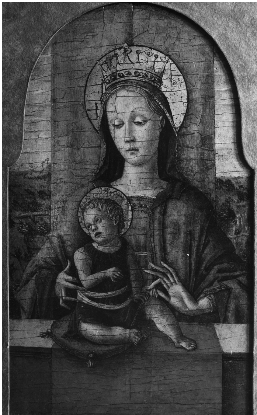
Fig. 11. Carlo Crivelli, Madonna con il Bambino (già Speyer, poi Cini), 1455 circa, 28×18 cm, tempera e olio su tavola, Venezia, Fondazione Giorgio Cini, Fototeca dell'Istituto di Storia dell'Arte, Fondo Pallucchini