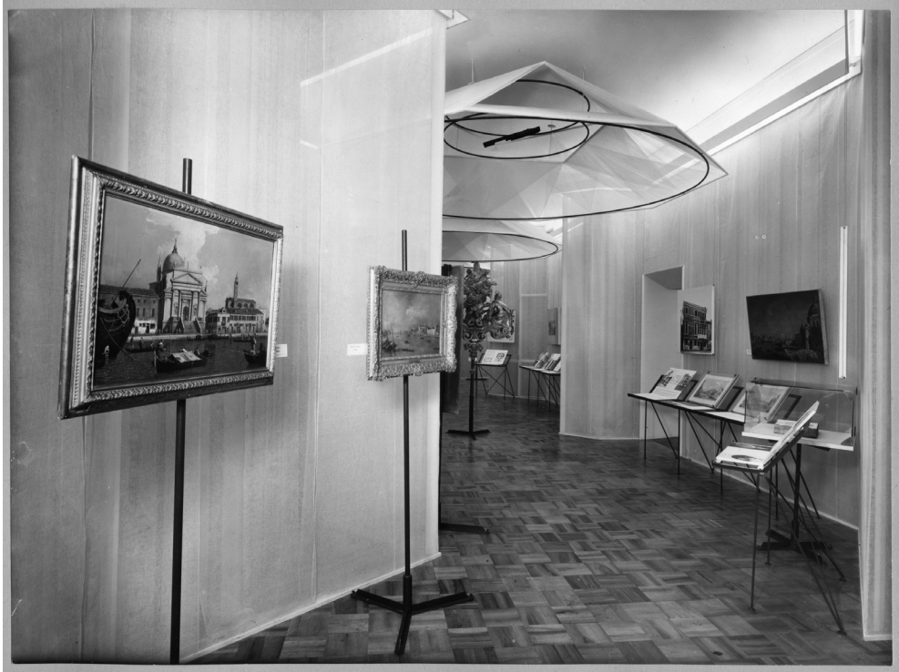
Fig. 1. “Venezia Viva”, sale del Settecento (Venezia, Palazzo Grassi, 7 agosto – 17 ottobre 1954), consulenti: Terisio Pignatti e Luigi Lanfranchi; architetto Franco Albini, Università Iuav di Venezia, Archivio Progetti