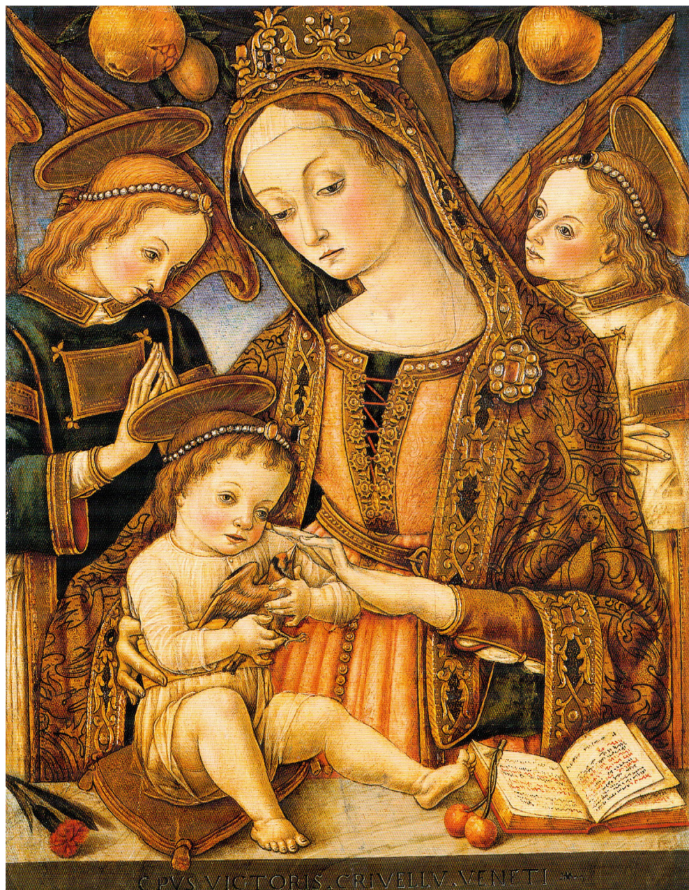
Fig. 15. Vittore Crivelli, Madonna con il Bambino e angeli , tavola firmata OPVS VICTORIS CRIVELLI VENETI, New York, Metropolitan Museum