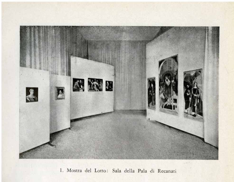
Fig. 6. "Mostra di Lorenzo Lotto", sala del polittico di San Domenico , (Venezia, Palazzo Ducale, 14 giugno – 18 ottobre 1953), allestimento di Carlo Scarpa e Pietro Zampetti, Archivio fotografico della Fondazione dei Musei civici di Venezia