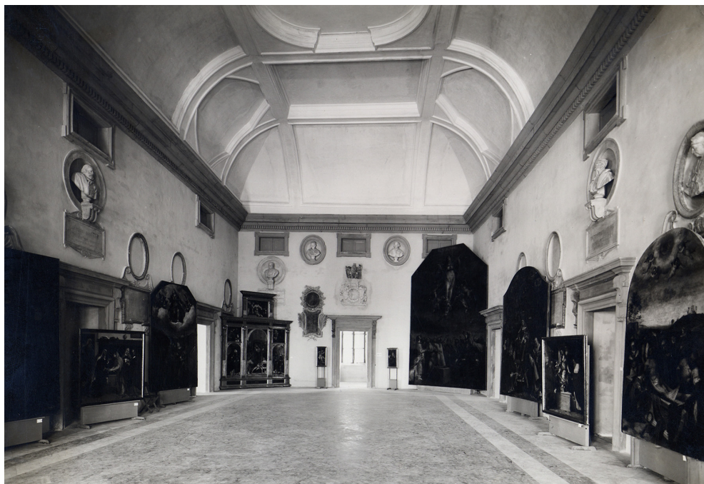
Fig. 4. “Mostra della Pittura Veneta nelle Marche”, salone d’onore (Ancona, Palazzo degli Anziani, 5 agosto – 30 settembre 1950), Archivio fotografico, Soprintendenza Archeologica, Belle Arti e Paesaggio per le provincie di Ancona e Pesaro Urbino, Fondo ex Soprintendenza ai Monumenti, negativo 28671