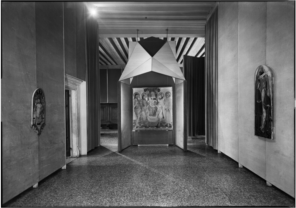
Fig. 10. Mostra “Carlo Crivelli e i crivelleschi”, sala di Nicola di Maestro Antonio di Ancona (Venezia, Palazzo Ducale, 10 giugno – 10 ottobre 1961), allestimento di Egle Renata Trincolato