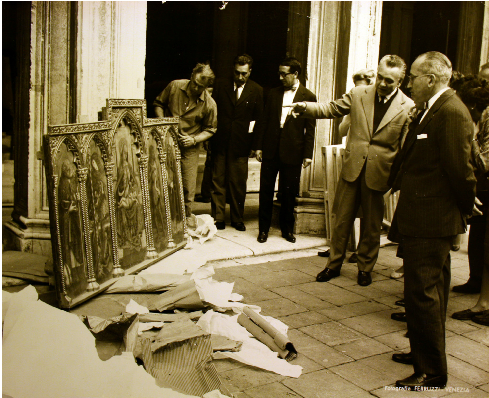
Fig. 7. Mostra “Carlo Crivelli e i crivelleschi”, ordine inferiore del polittico di Monte San Martino (Venezia, Palazzo Ducale, 10 giugno – 10 ottobre 1961), arrivo delle casse a Venezia, Archivio privato Pietro Zampetti