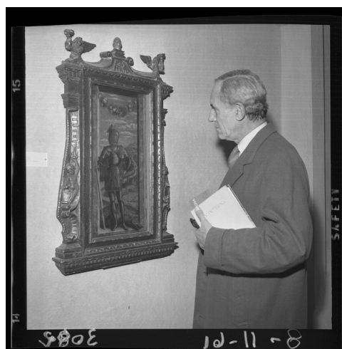
Fig. 9. Philippe Handy, direttore della National Gallery di Londra, in visita alla mostra "Andrea Mantegna", davanti al San Giorgio (Mantova, Palazzo Ducale, settembre – ottobre 1961), Fototeca della Biblioteca "G. Baratta" di Mantova, Fondo fotografico Gazzetta di Mantova, autore fototipo Quinto Sbarberi, data fototipo 8 novembre 1961