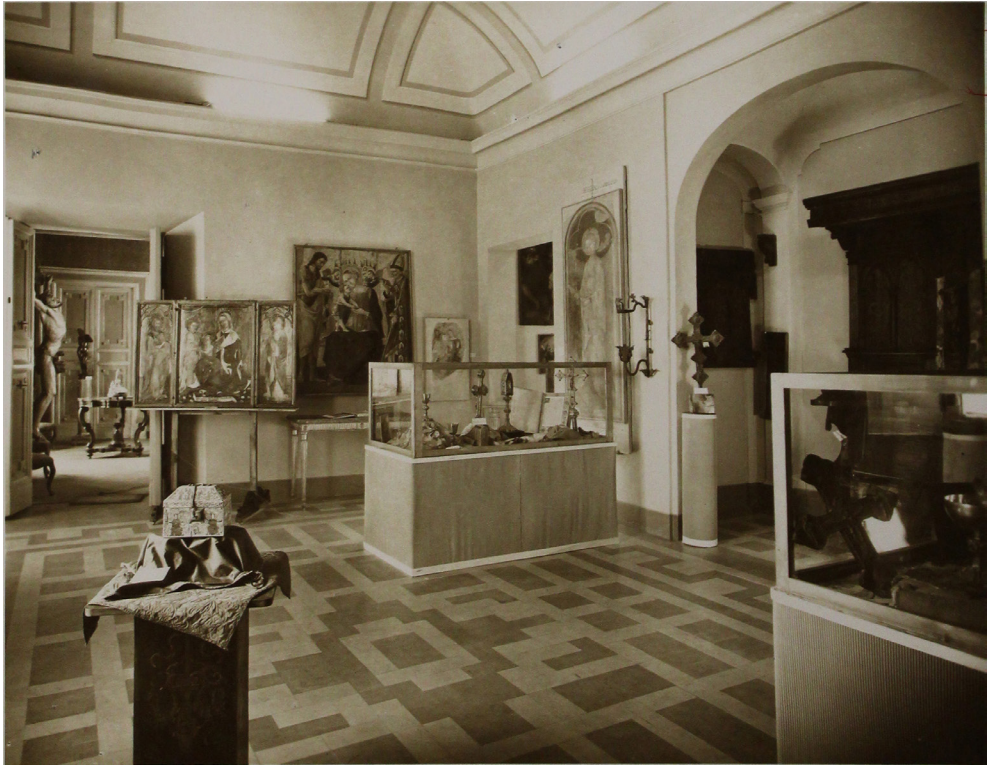
Fig. 5. La Pinacoteca civica di San Severino Marche dopo il riallestimento di Pietro Zampetti del 1953, Palazzo comunale, sala principale, data dell'immagine 1954, Archivio fotografico, Soprintendenza Archeologica, Belle Arti e Paesaggio per le provincie di Ascoli Piceno, Fermo e Macerata, Fondo ex Soprintendenza ai Monumenti, negativo nn.