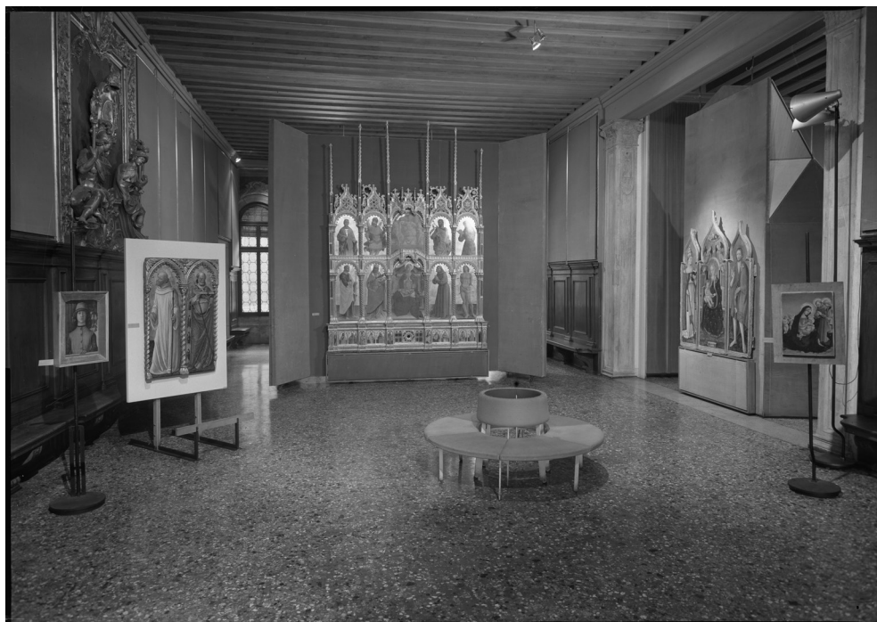
Fig. 13. Mostra "Carlo Crivelli e i crivelleschi", sala di Lorenzo d'Alessandro (Venezia, Palazzo Ducale, 10 giugno – 10 ottobre 1961), allestimento di Egle Renata Trincolato