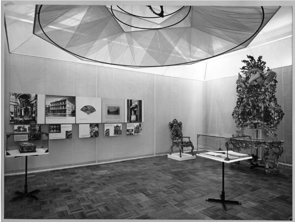
Fig. 2. "Venezia Viva", sale del Settecento (Venezia, Palazzo Grassi, 7 agosto – 17 ottobre 1954), consulenti Terisio Pignatti e Luigi Lanfranchi; architetto Franco Albini, Università Iuav di Venezia, Archivio Progetti