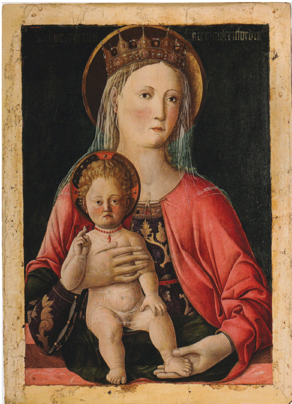
Fig. 2. Gentile Bellini, Madonna col Bambino , Matelica (MC), Museo Piersanti