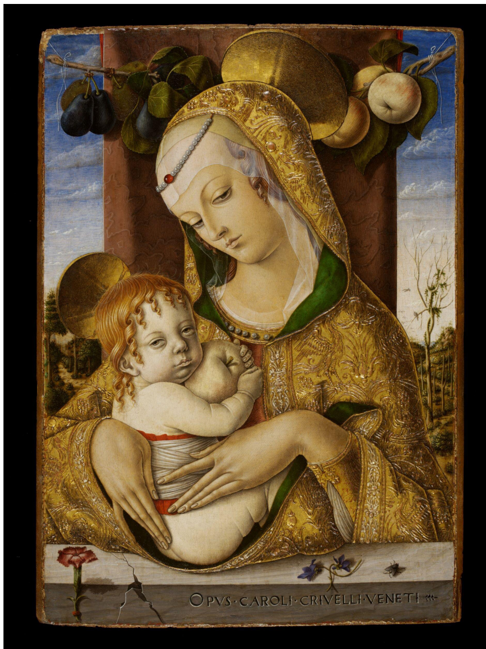
Fig. 9 Carlo Crivelli, Madonna col Bambino , 1480 ca., Londra, Victoria and Albert Museum