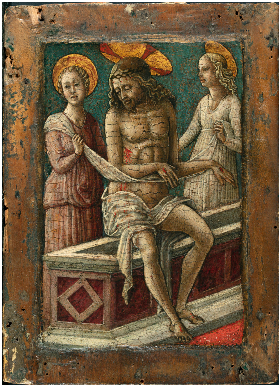
Fig. 1. Carlo Crivelli (attr.), Cristo morto tra due angeli , 1457 ca., Milano, collezione privata