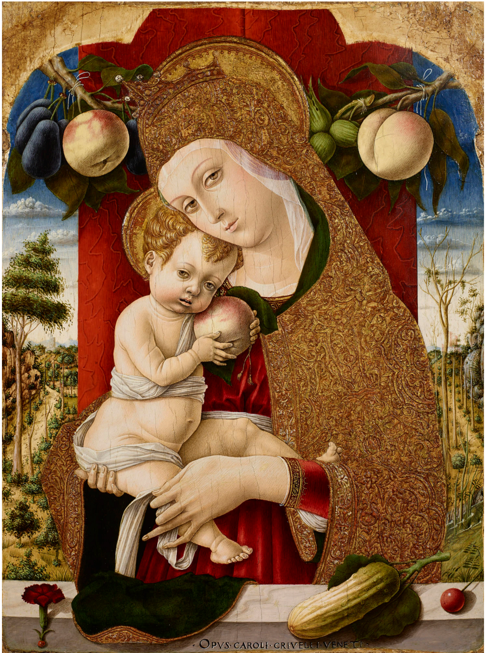
Fig. 10. Carlo Crivelli, Madonna col Bambino , 1482 ca., Bergamo, Accademia Carrara