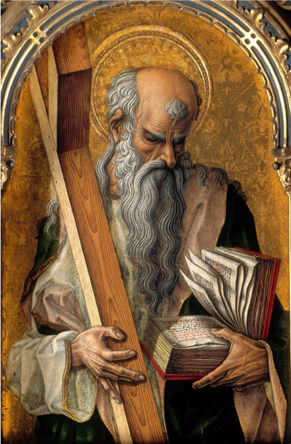
Fig. 6. Carlo Crivelli, Sant'Andrea , 1476, Londra, The National Gallery