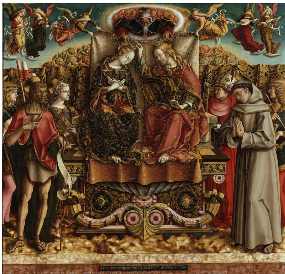
Fig. 3. Carlo Crivelli, Incoronazione della Vergine , 1493, Milano, Pinacoteca di Brera