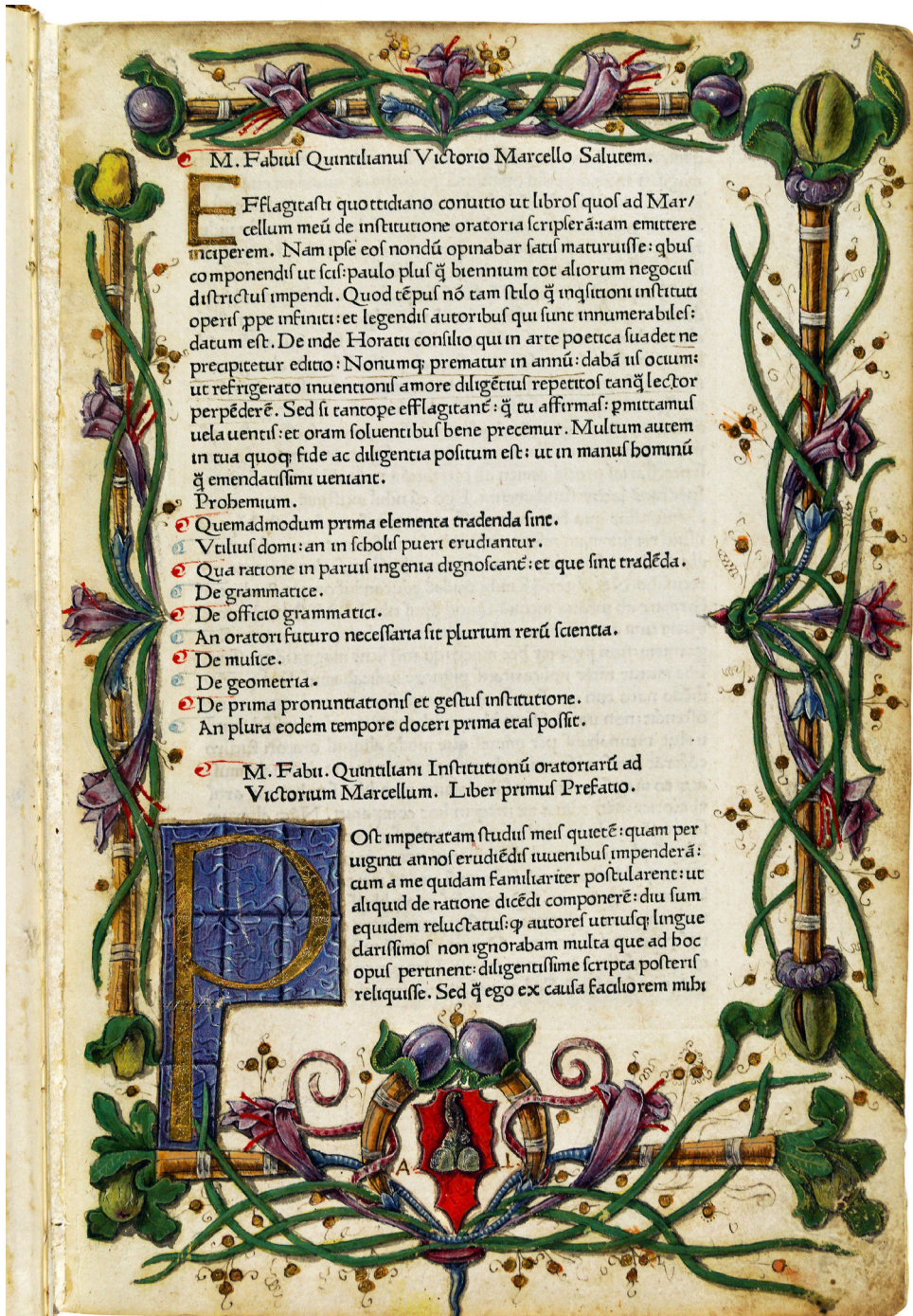
Fig. 2. già attr. a Carlo Crivelli, Institutio oratoria , frontespizio, vol. inc. 285, Roma, Biblioteca Casanatense