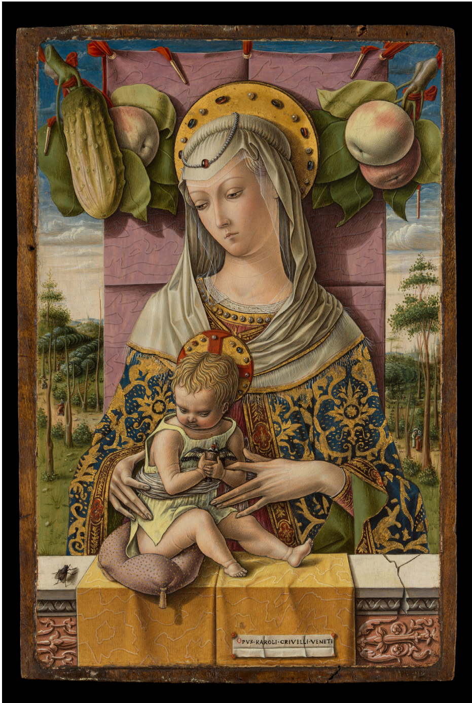
Fig. 8. Carlo Crivelli, Madonna col Bambino , 1480 ca., New York, The Metropolitan Museum