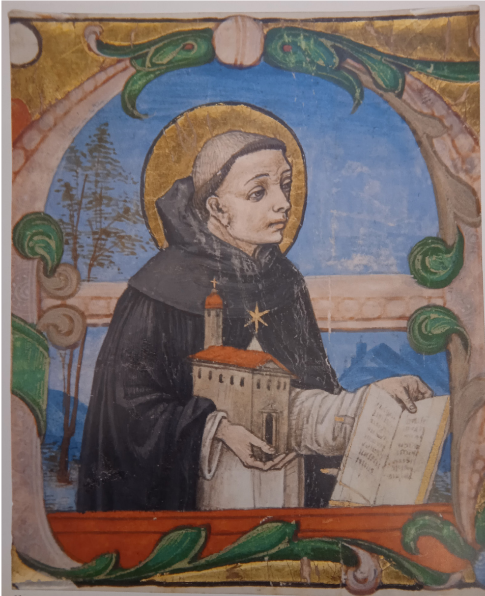
Fig. 4. Miniature dell'Italia settentrionale, San Domenico , 1475 ca., collezione privata