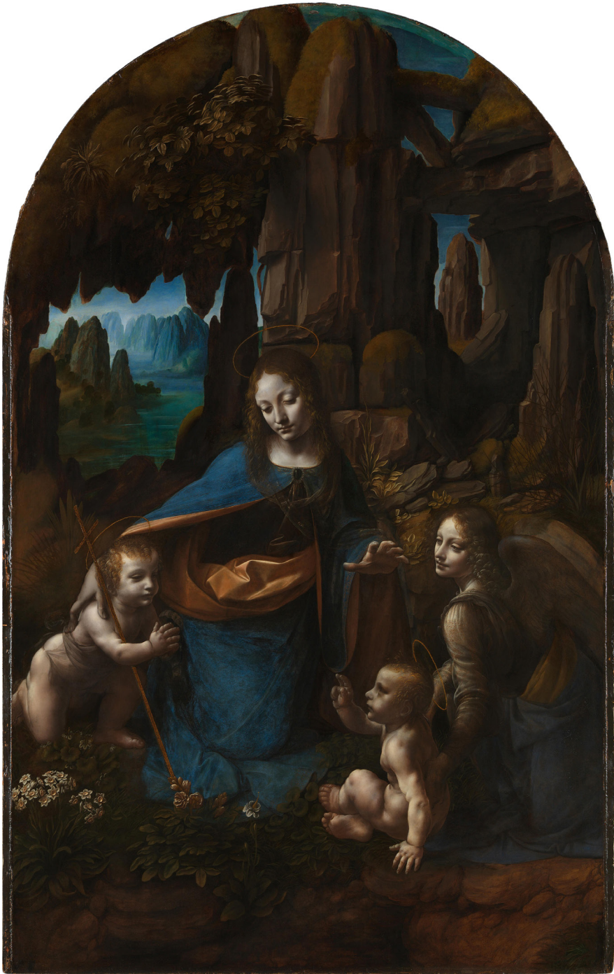
Fig. 12. Leonardo da Vinci, La Vergine delle Rocce , 1491-92/1506-08 ca., Londra, The National Gallery