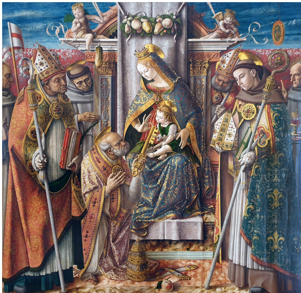
Fig. 11. Carlo Crivelli, La consegna delle chiavi a San Pietro , 1488, Berlino, Gemäldegalerie