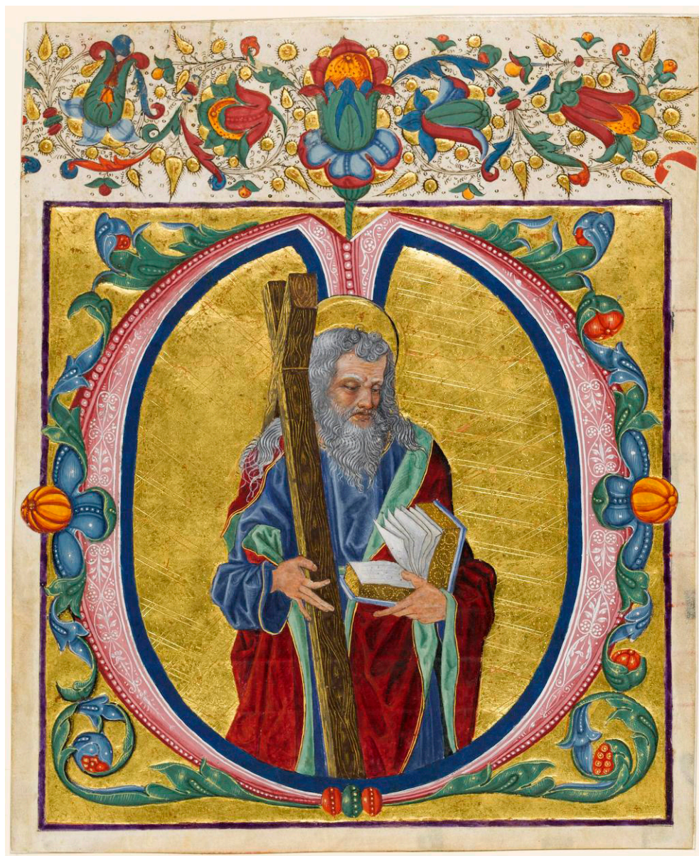
Fig. 5. Anonimo, Sant'Andrea , 1490 ca., Marlay cutting It. 26, Cambridge, Fitzwilliam Museum