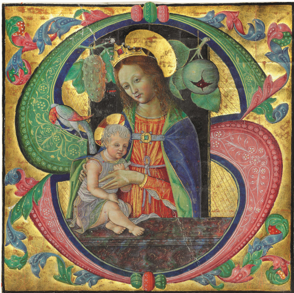
Fig. 7. Anonimo, Madonna col Bambino , 1490 ca., collezione privata