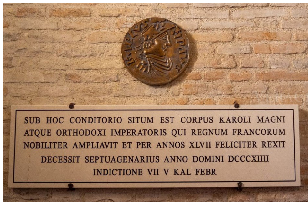
Fig. 2. La targa che segnala la tomba di Carlo Magno all'interno dell'Abbazia