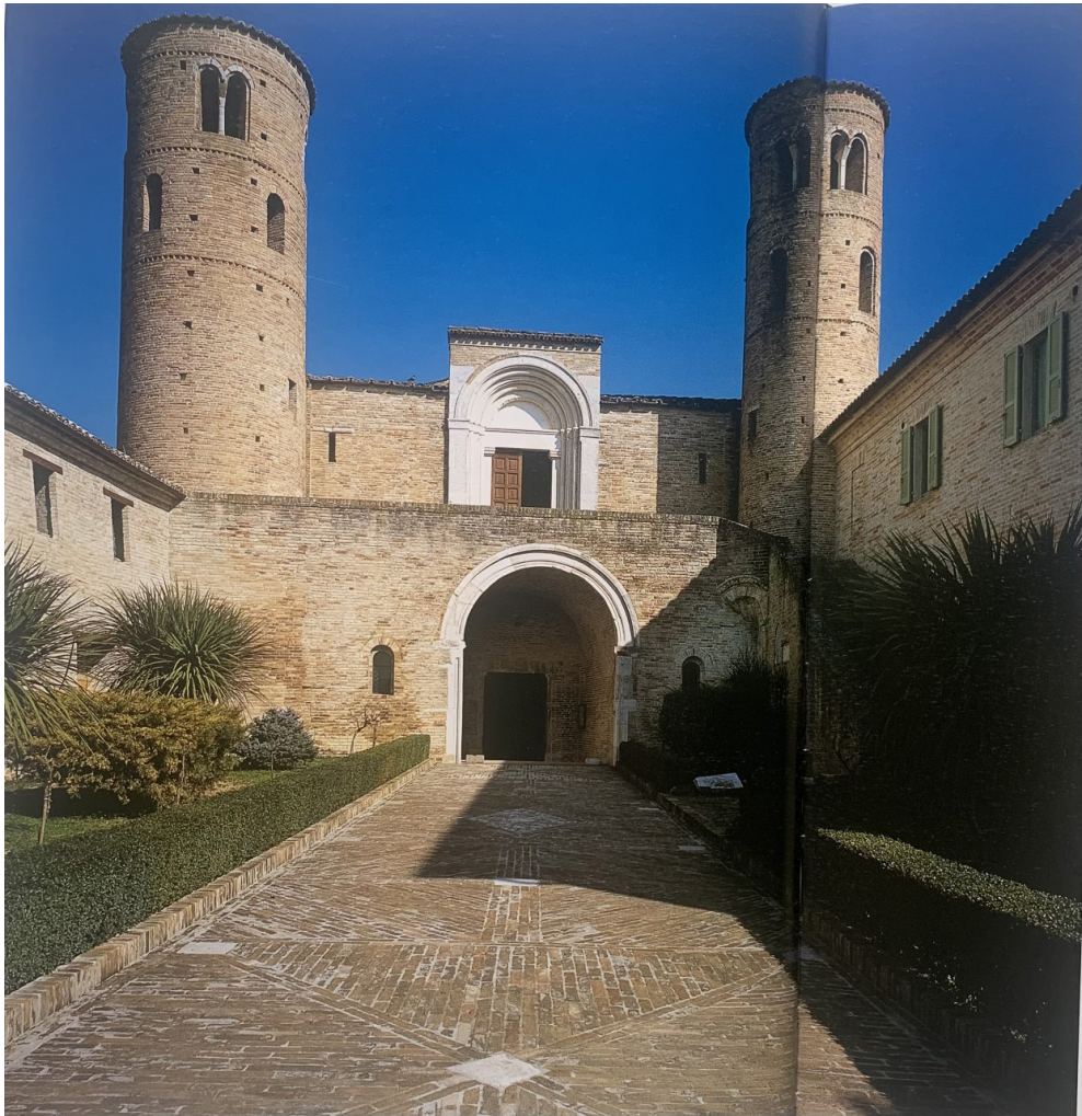
Fig. 1. L'Abbazia di San Claudio al Chienti