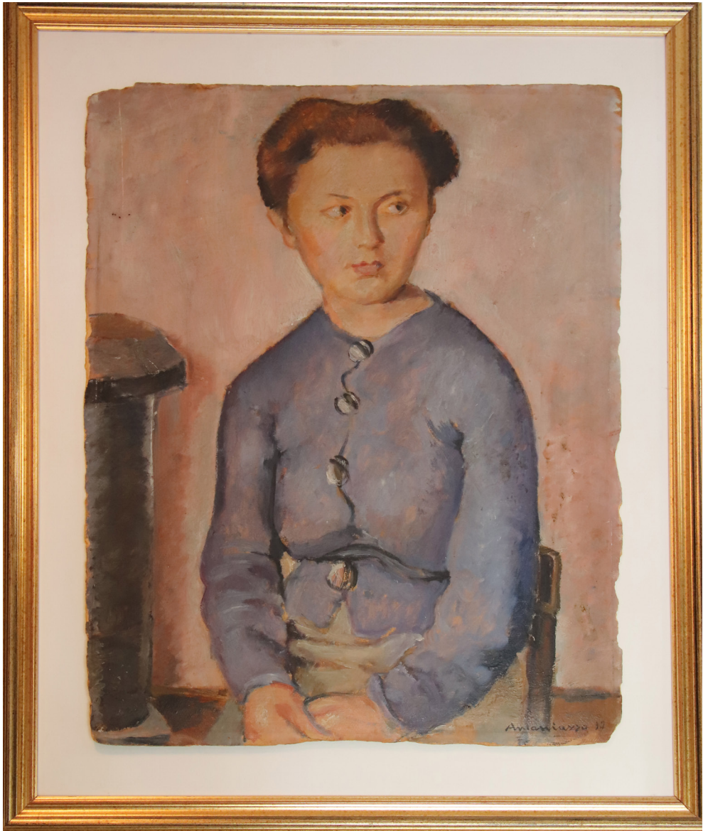
Fig. 1. Anna Antoniazio Bocchina, Autoritratto , olio su tela, 1937, Roma, Archivio Museo Storico di Fiume