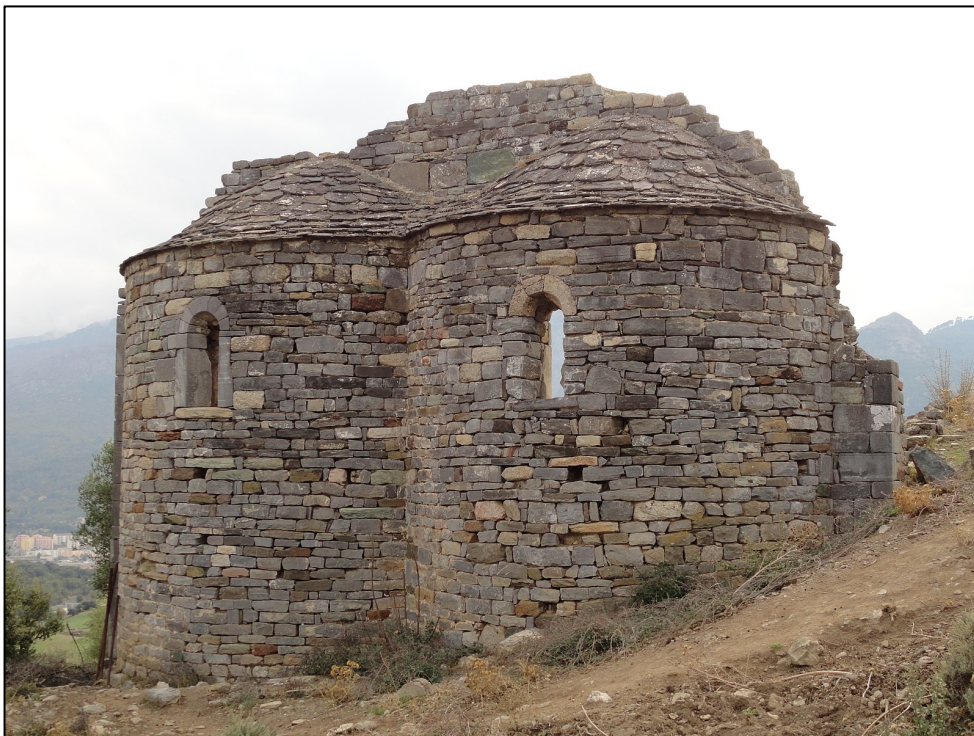
Fig. 6. Talcini, Santa Mariona, prospetto absidale.