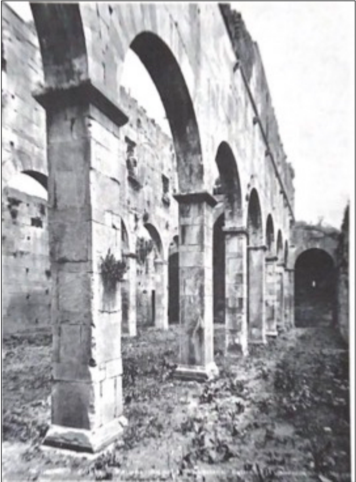
Fig. 7. Mariana (Lucciana, Haute Corse ), Santa Maria Assunta, fotografia che ritrae l'interno della Canonica prima dei restauri del 1913 (da Moracchini-Mazel 1967, p. 91).