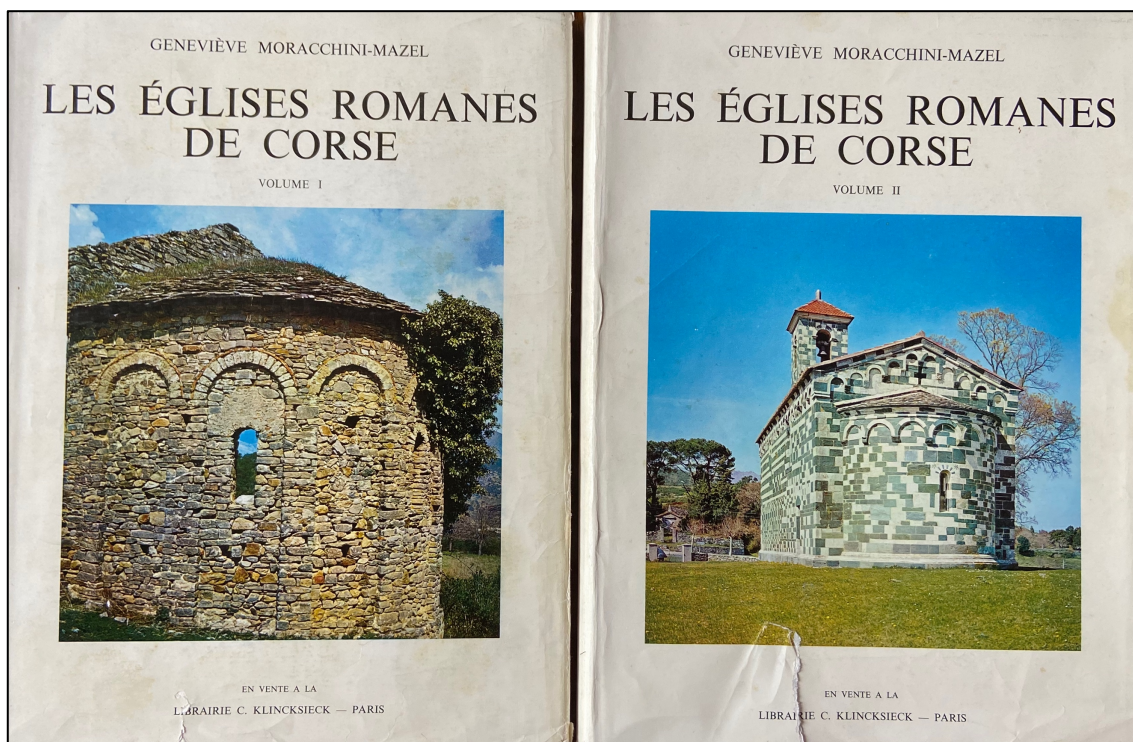
Fig. 2. Copertine dei due volumi de « Les Eglises romane de Corse ».