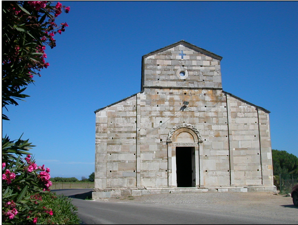
Fig. 5. Mariana (Lucciana, Haute Corse ), Santa Maria Assunta, facciata.