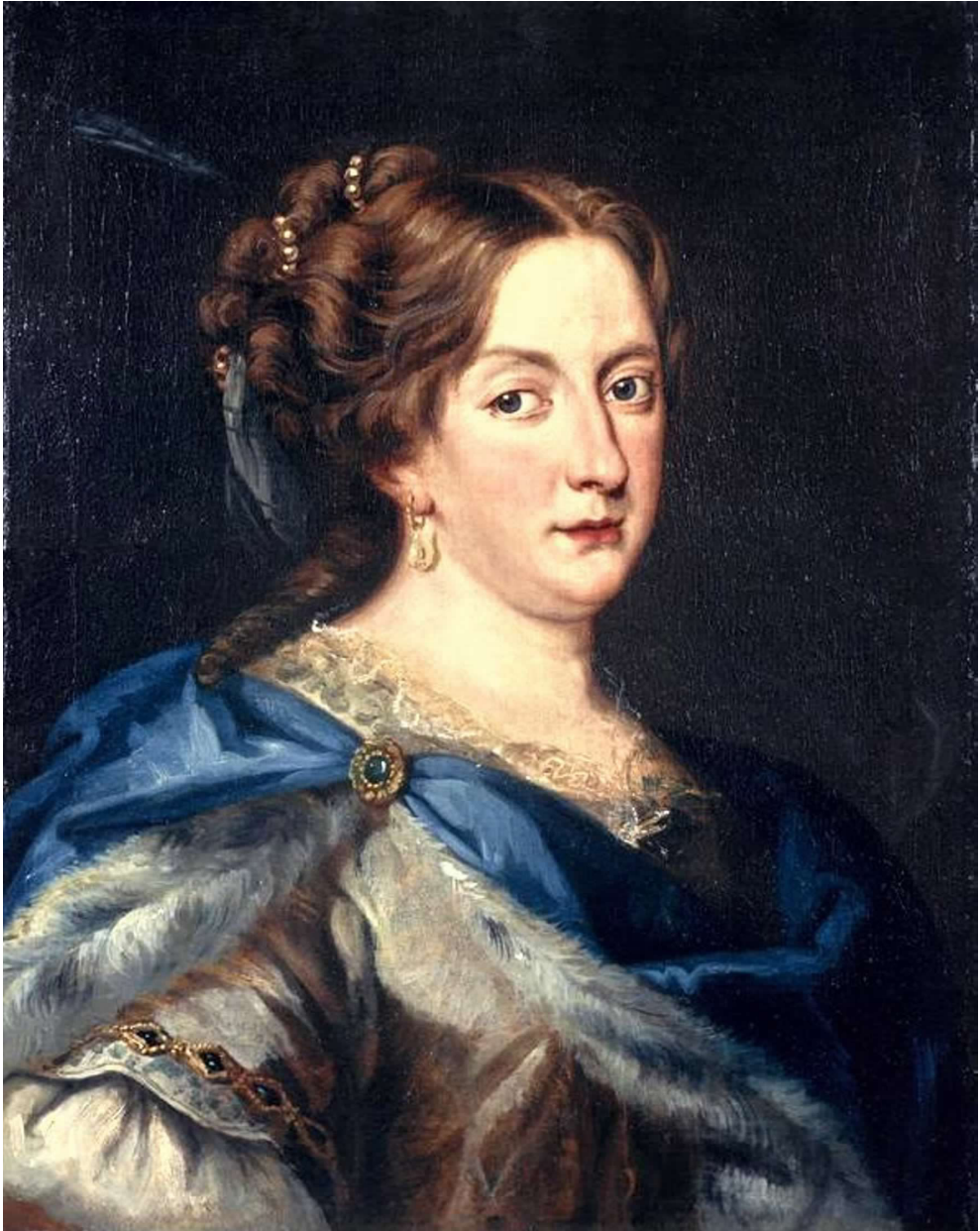
Fig. 1. Jacob Ferdinand Voet, Cristina di Svezia , olio su tela, 1670-1675, National Gallery of Scotland