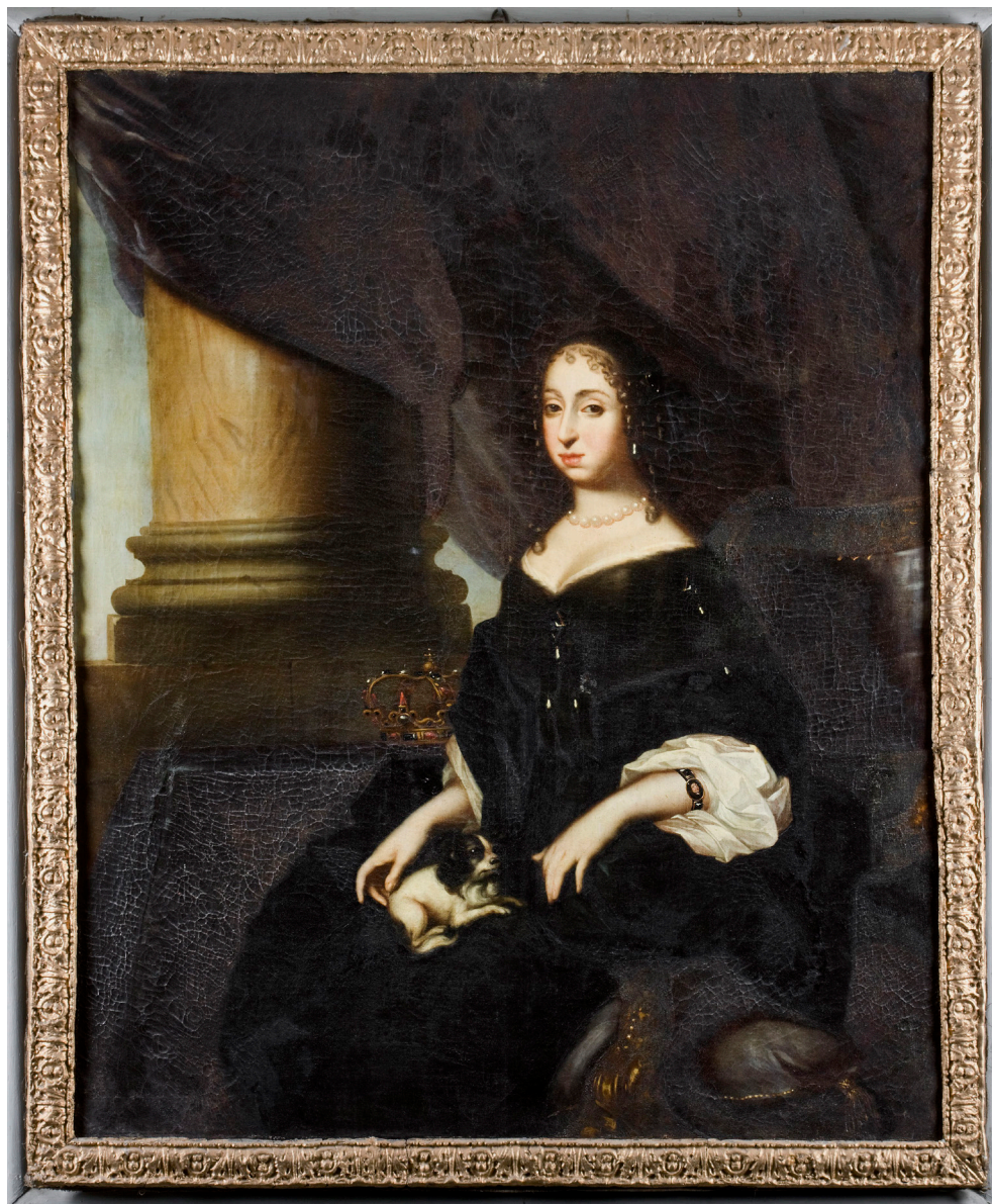
Fig. 4. David Klöcker Ehrenstrahl, Edvige Eleonora di Holstein-Gottorp , olio su tela, 1661-1675, Skokloster Castle