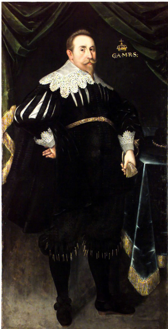
Fig. 2. Jacob Heinrich Elbfas, Gustavo II Adolfo , olio su tela, 1630, Skokloster Castle