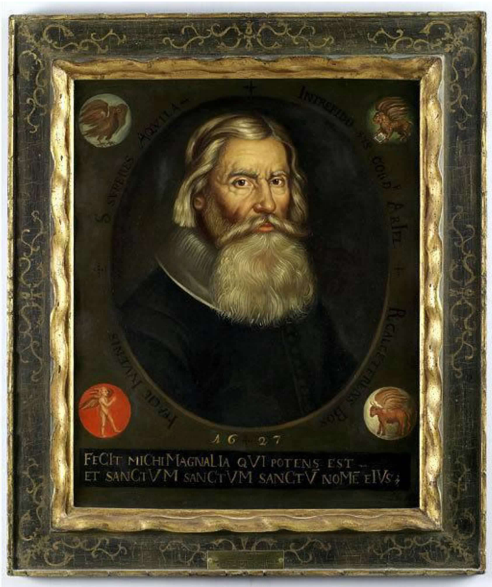
Fig. 3. Artista ignoto, Johannes Bureus , olio su tela, 1627, Gripsholm Castle