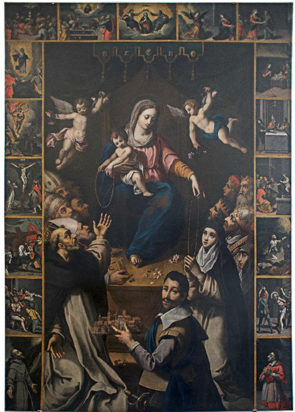
Fig. 6. Ernst van Schayck, Madonna del Rosario , Sant'Elpidio a Mare (FM), Pinacoteca civica Vittore Crivelli