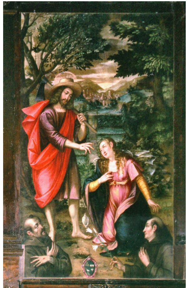
Fig. 8. Ambito fiammingo (?), Noli me tangere , Tolentino (MC), chiesa di San Catervo