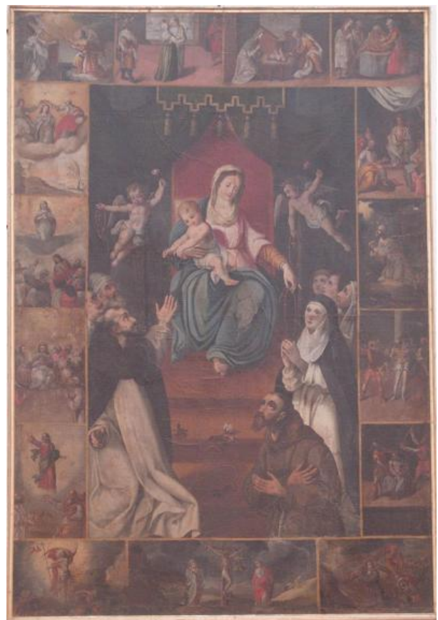
Fig. 2. Ernst van Schayck, Madonna del Rosario con le storie della Vergine e di Gesù , Polverigi (AN), chiesa di Sant'Antonino Martire