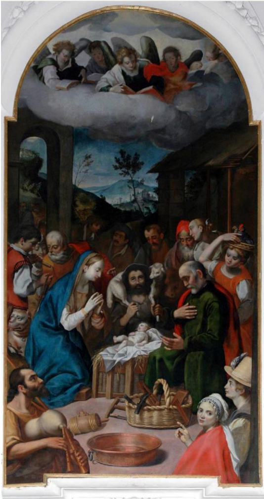
Fig. 1. Ernst van Schayck, Adorazione dei pastori , Camerano (AN), chiesa di San Francesco