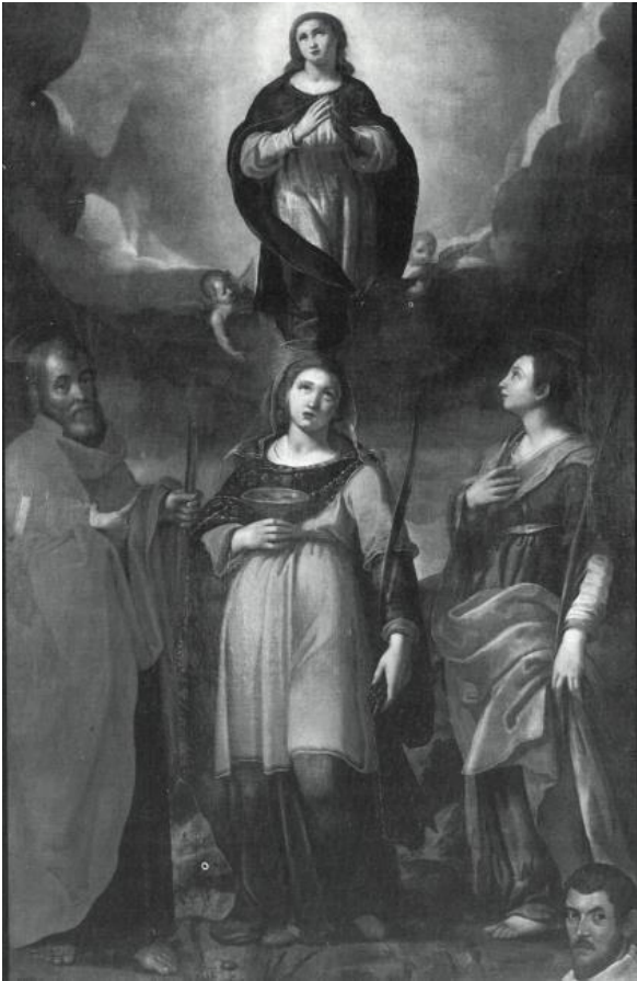
Fig. 5. Ernst van Schayck, Immacolata, santi e donatore , Ripatransone (AP), Palazzo Bonomi-Gera, Pinacoteca civica