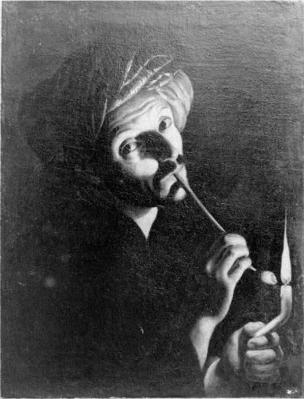
Fig. 9. Maestro del lume di candela (?), Uomo con turbante che si accende la pipa , Montefortino (FM), Palazzo Leopardi, Pinacoteca civica Fortunato Duranti