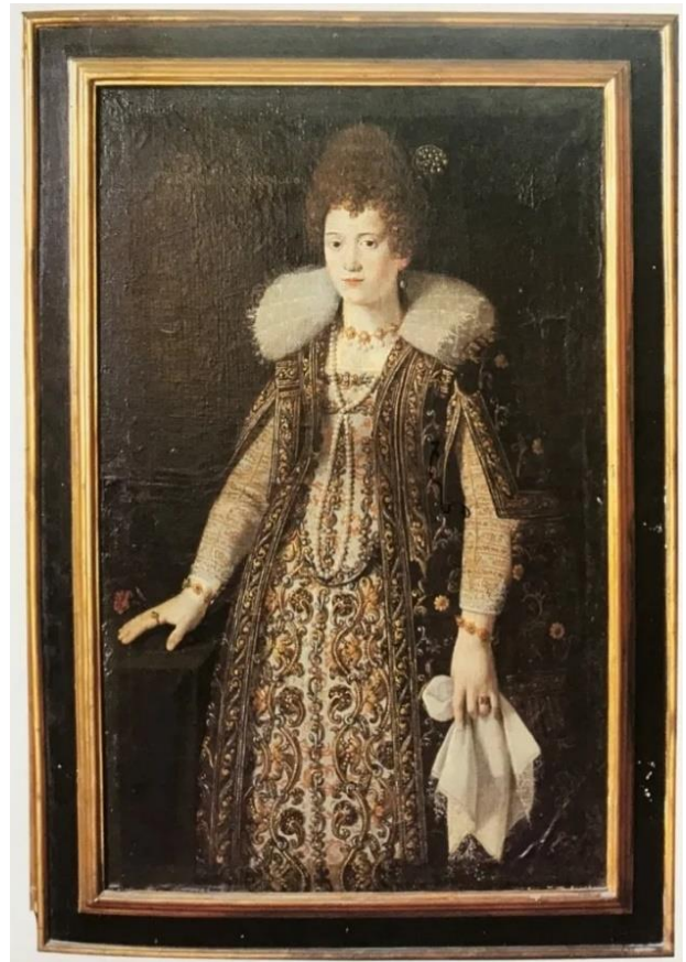
Fig. 4. Ernst van Schayck, Ritratto di Barbara Moroni , Recanati (MC), casa Leopardi