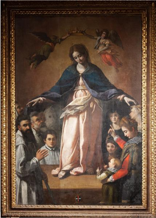
Fig. 3. Ernst van Schayck, Madonna della Misericordia , Filottrano (AN), chiesa di Santa Maria Assunta