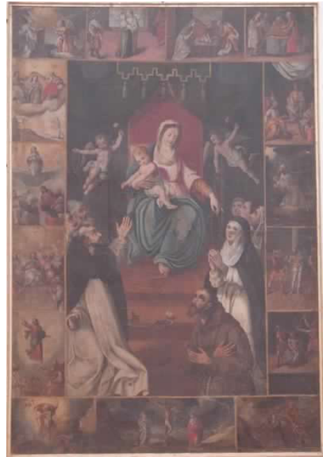
Fig. 2. Ernst van Schayck, Madonna del Rosario con le storie della Vergine e di Gesù , Polverigi (AN), chiesa di Sant'Antonino Martire