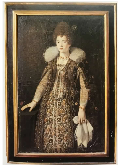
Fig. 4. Ernst van Schayck, Ritratto di Barbara Moroni , Recanati (MC), Casa Leopardi