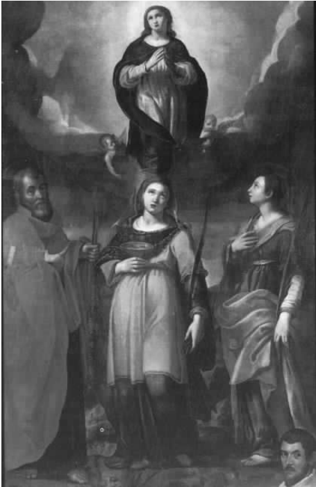
Fig. 5. Ernst van Schayck, Immacolata, santi e donatore , Ripatransone (AP), Palazzo Bonomi-Gera, Pinacoteca civica