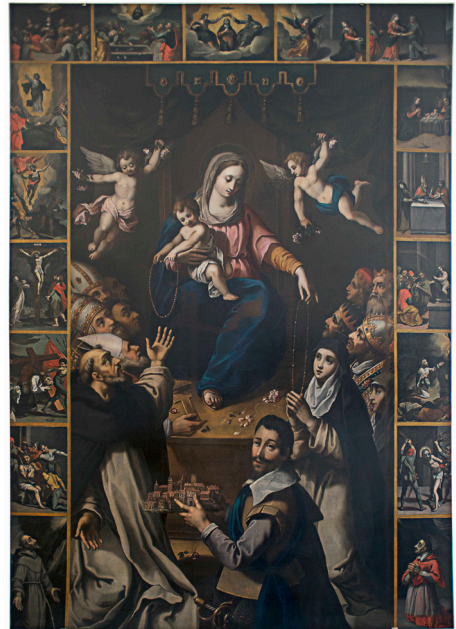
Fig. 6. Ernst van Schayck, Madonna del Rosario , Sant'Elpidio a Mare (FM), Pinacoteca civica Vittore Crivelli