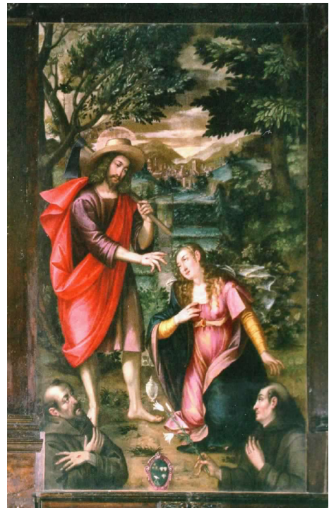
Fig. 8. Ambito fiammingo (?), Noli me tangere , Tolentino (MC), chiesa di San Catervo