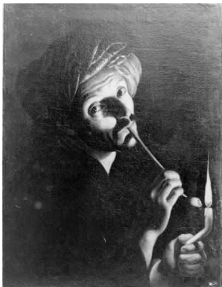
Fig. 9. Maestro del lume di candela (?), Uomo con turbante che si accende la pipa , Montefortino (FM), Palazzo Leopardi, Pinacoteca civica Fortunato Duranti