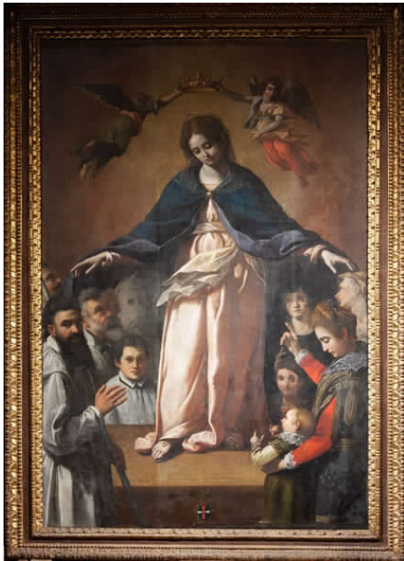
Fig. 3. Ernst van Schayck, Madonna della Misericordia , Filottrano (AN), chiesa di Santa Maria Assunta