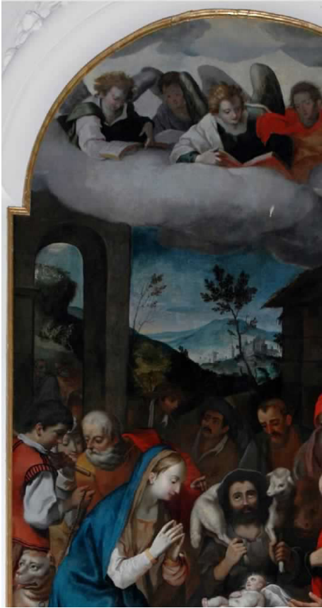
Fig. 1. Ernst van Schayck, Adorazione dei pastori , Camerano (AN), chiesa di San Francesco