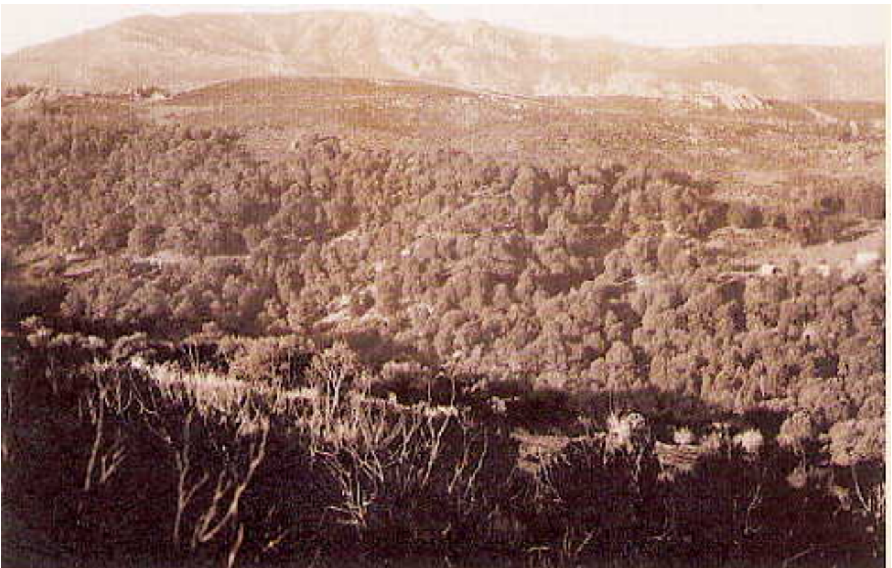
Fig. 6-7. Antonio Ballero, due vedute della Barbagia,