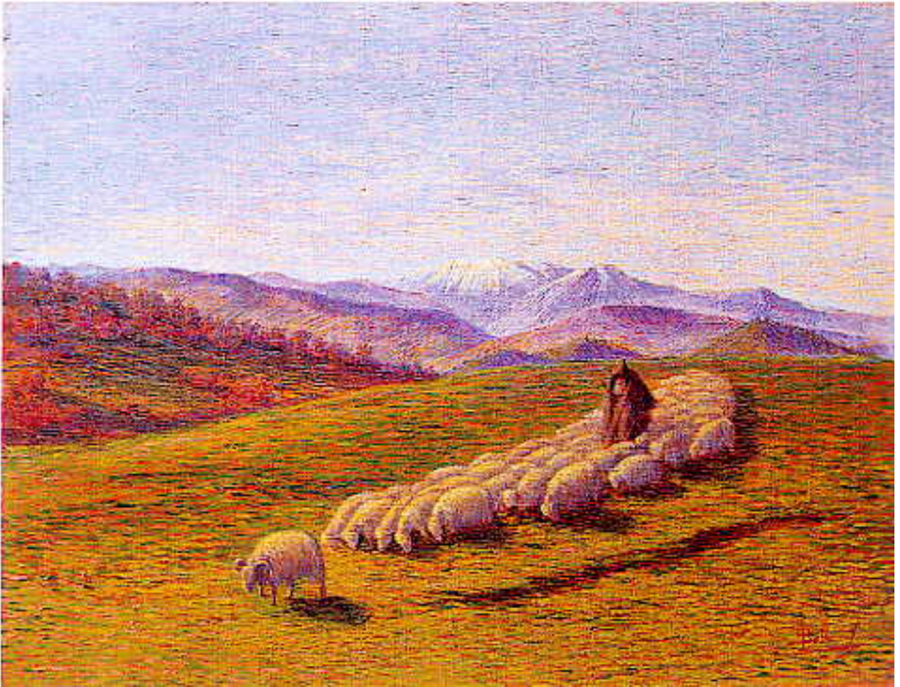
Fig. 3. A. Ballero, Mattino di marzo , marzo 1904