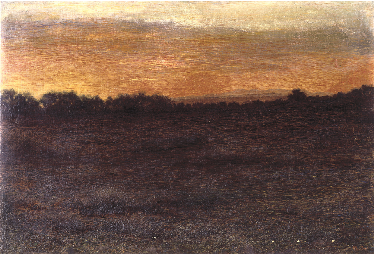
Fig. 5. A. Ballero, Dopo il tramonto , 1905