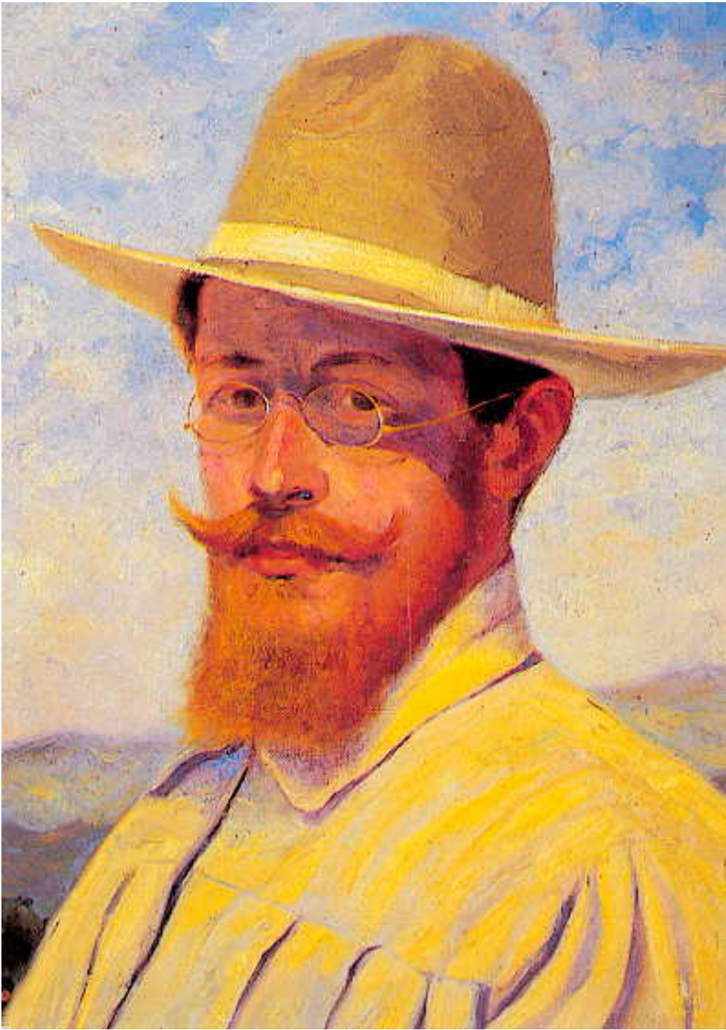
Fig. 9. Antonio Ballero, Autoritratto al sole , 1907