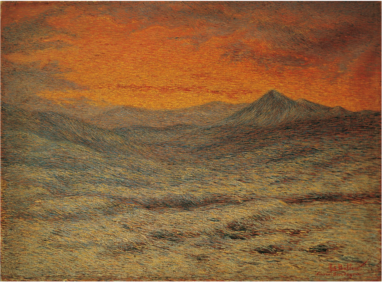
Fig. 8. Antonio Ballero, Paesaggio al tramonto , 1906-7