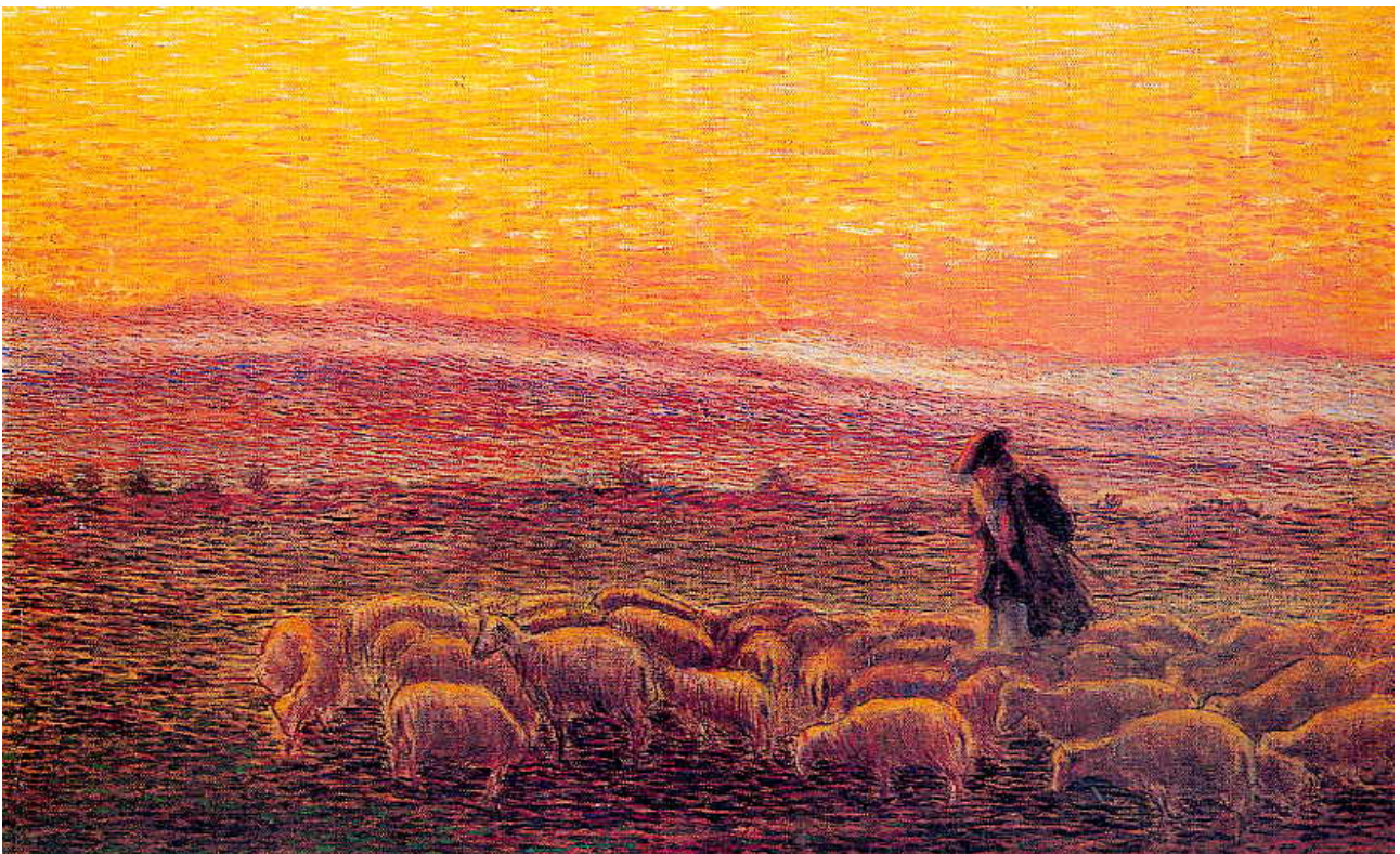
Fig. 2. A. Ballero, L'appello serale , 1904.