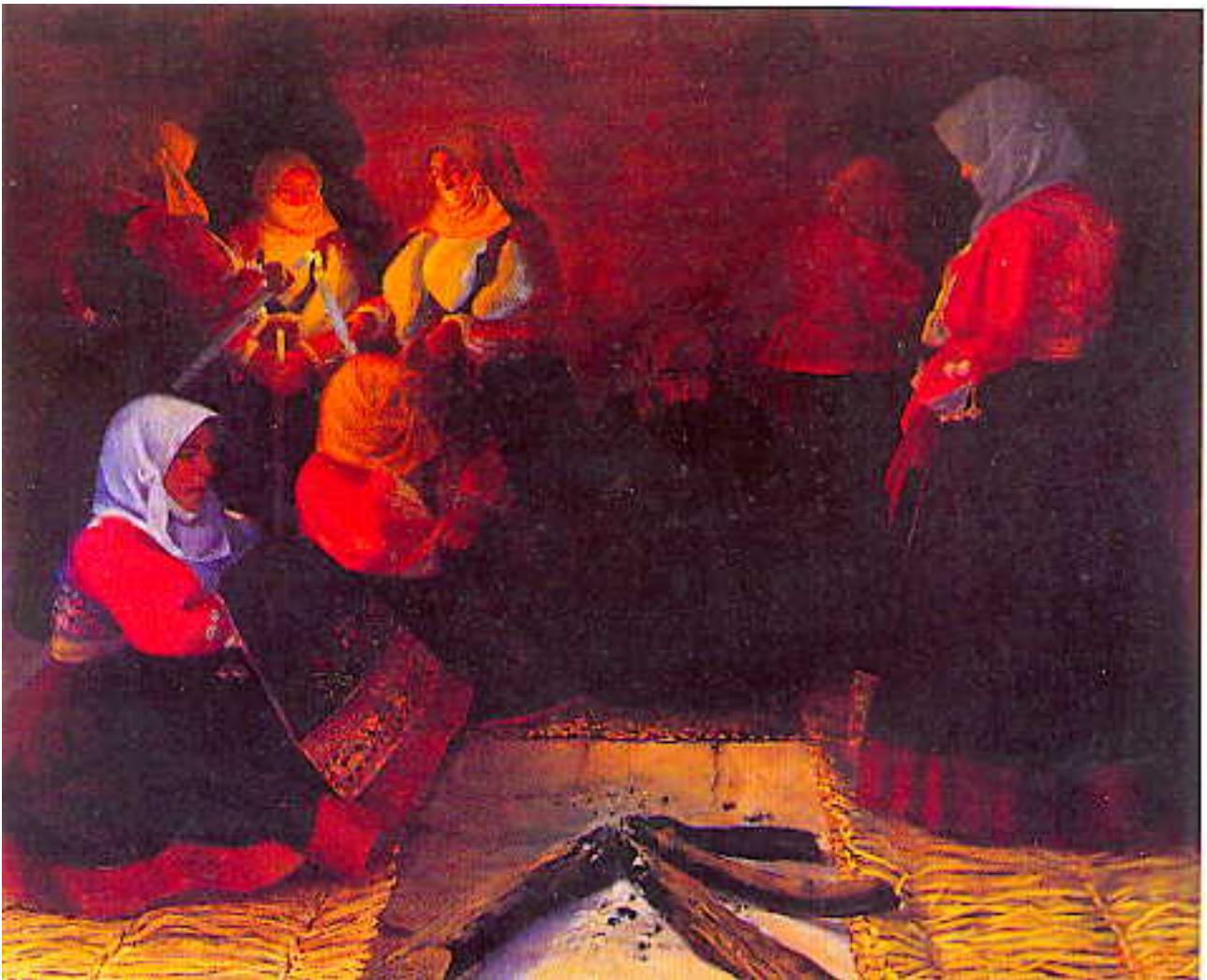
Fig. Antonio Ballero, Sa Ria (Il duolo) , 1907-8