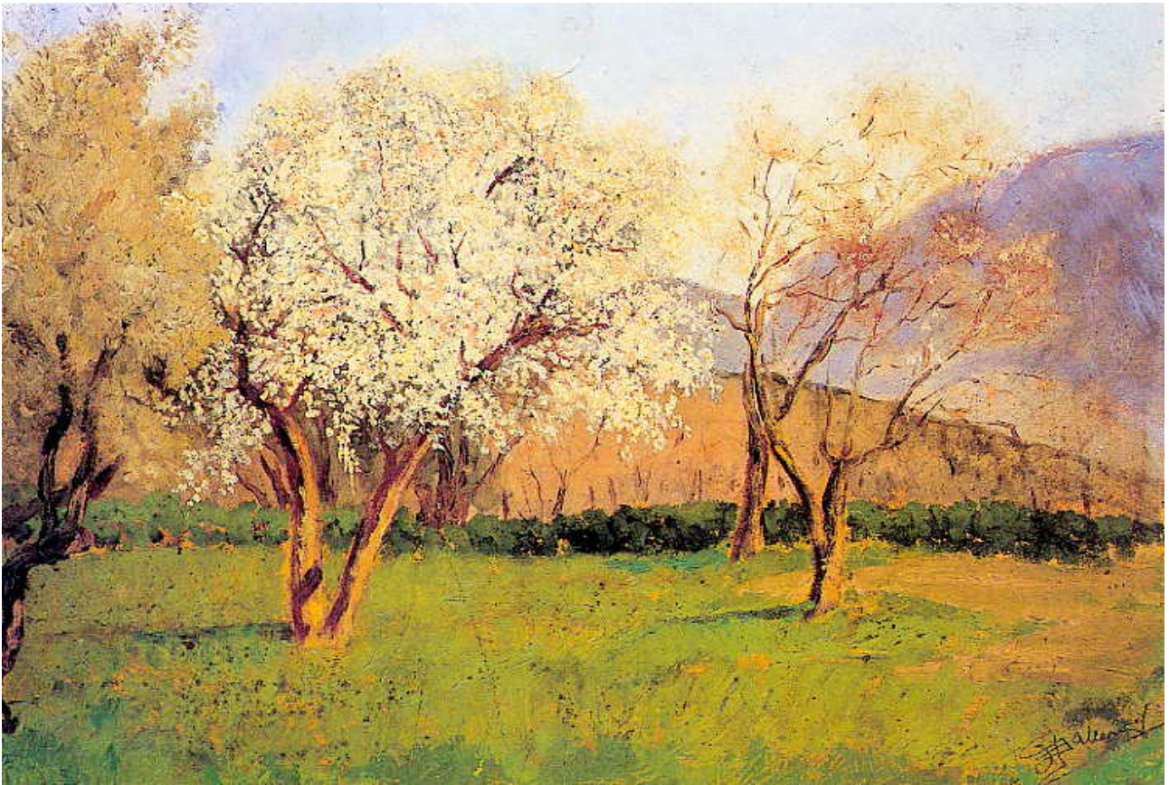
Fig. 1. A. Ballero, Baddemanna , gennaio 1903.