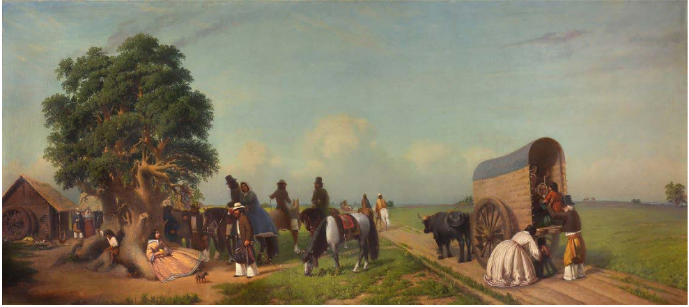
Fig. 9. Prilidiano Pueyrredón, Un alto en el campo (1861)