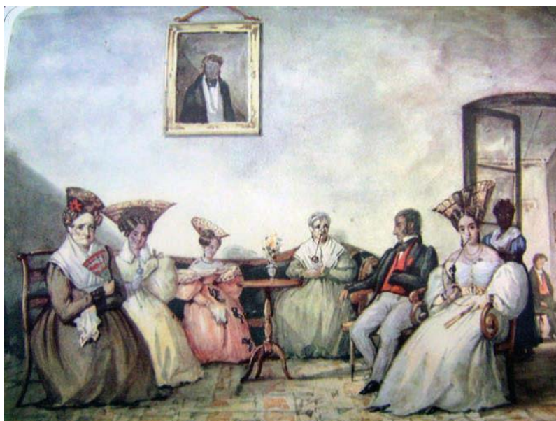
Fig. 8. Carlos E. Pellegrini, Tertulia porteña (1831 ca.)