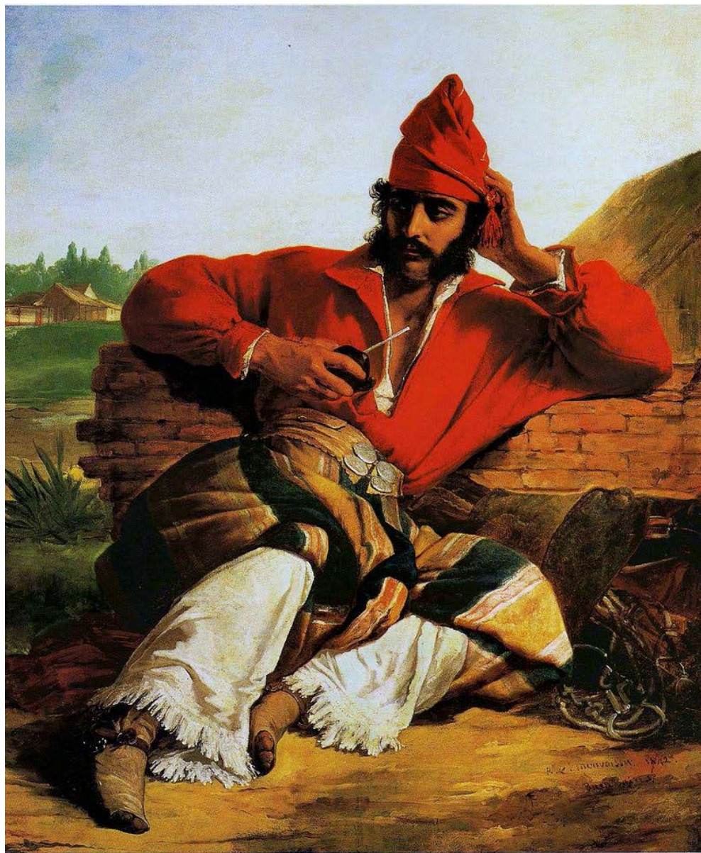
Fig. 4. Raymond Monvoisin, Soldado de la guardia de Rosas (1842)