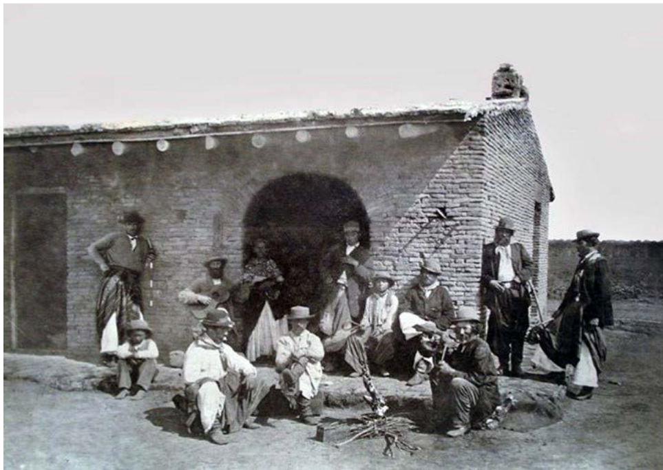
Fig. 2. Gauchos intorno al fuoco (1862 ca.)