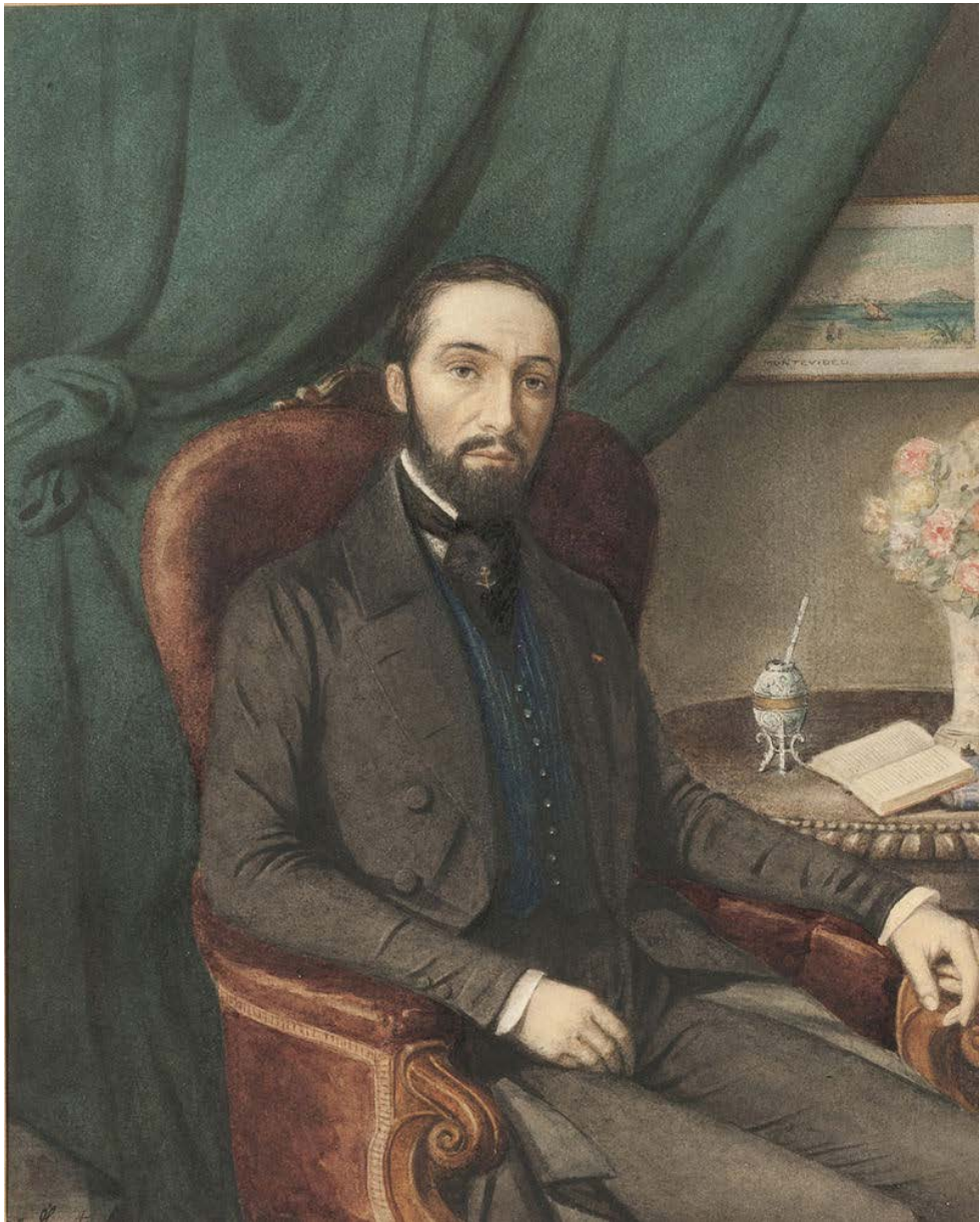
Fig. 6. Adolphe d'Hastrel, Autorretrato (1870 ca.)