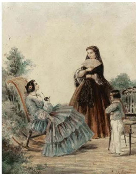
Fig. 7. Jean León Pallière, Tomando mate (1861 ca.)