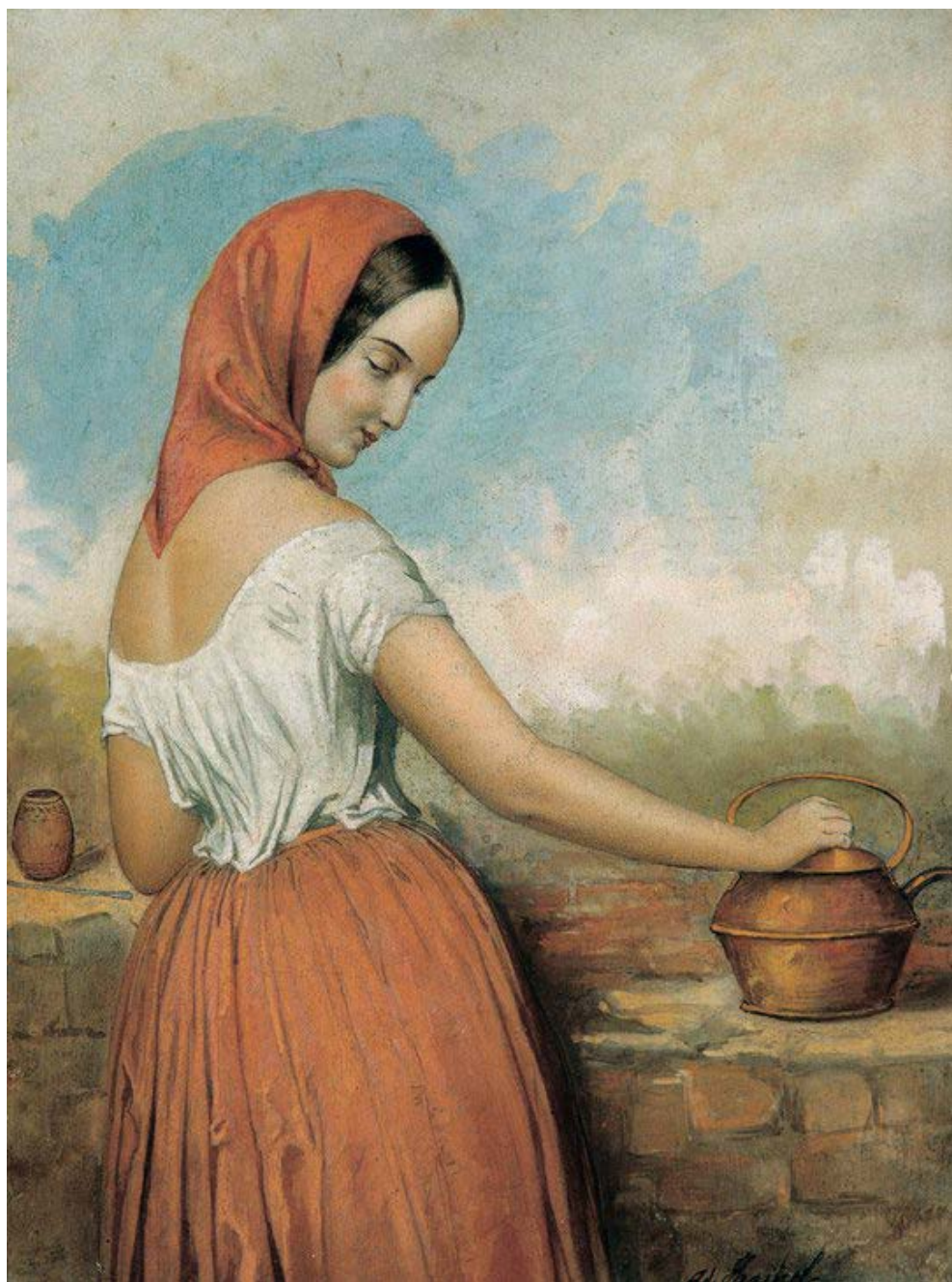
Fig. 5. Adolphe d'Hastrel, Cebando mate (184?)