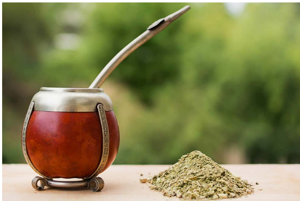
Fig. 1. Mate