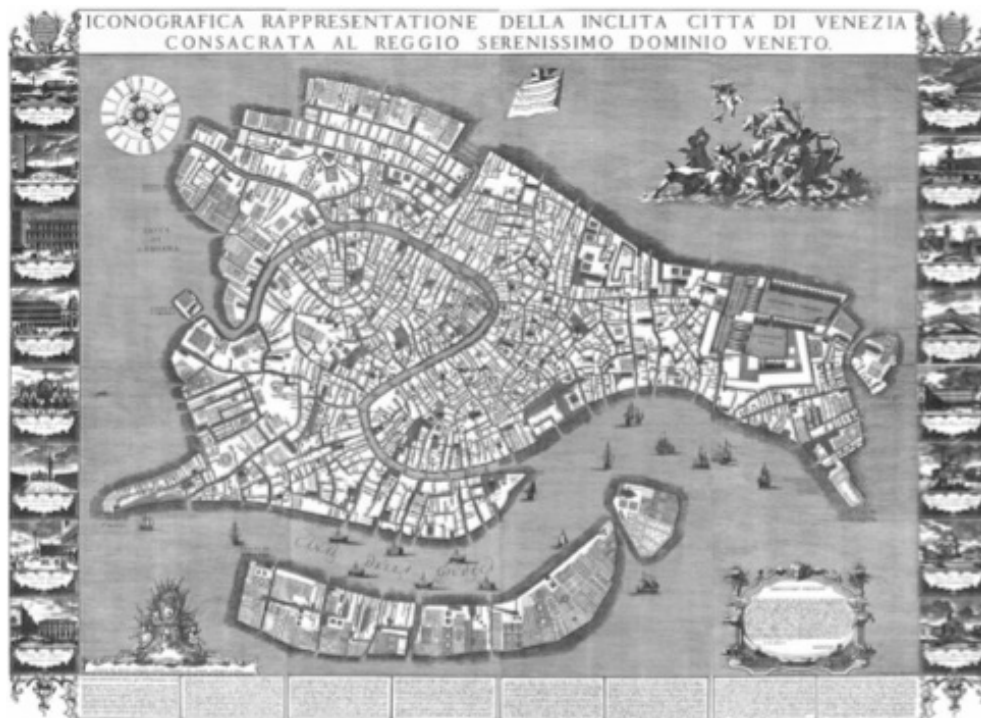
Fig. 1. Pianta di Venezia di Ludovico Ughi, 1729 , < http://www.iuav.it/Ricerca1/ATTIVITA-/aree-temat/memoria-ra/progetti/La-Pianta-/1.jpg >, 25.08.2019