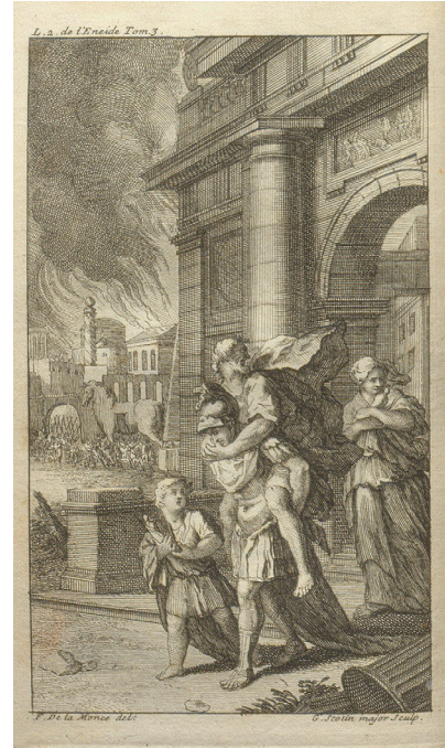
Fig. 8. G. Scotin da F. de la Monce, Fuga d'Enea , incisione, da Catrou 1716, p. 173