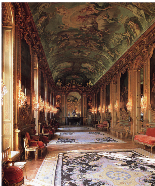
Fig. 1. La Galerie dorée nel Hôtel de Toulouse (Banque de France), ex Galerie La Vrillière, da Friedman 1990, p. 89