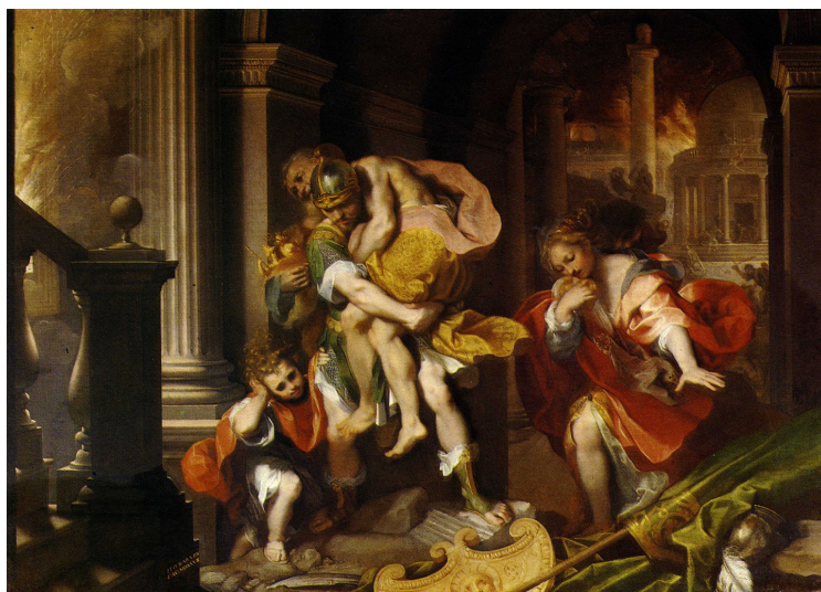
Fig. 2. Federico Barrocci, La fuga d'Enea , 1598, Roma, Galleria Borghese, da Andrea Emiliani, Federico Barrocci , Bologna 1985