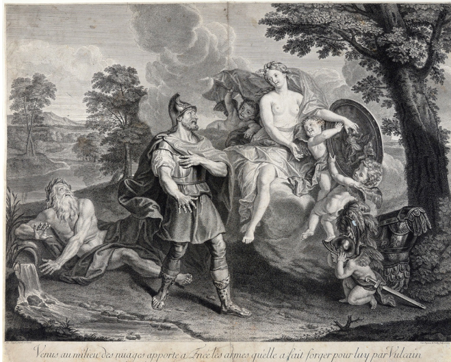
Fig. 9. Jean-Baptiste de Poilly da Antoine Coypel, Venere offre le armi ad Enea , incisione, Monaco di Baviera, Ludwig-Maximilian-Universität, Institut für Kunstgeschichte, da Prometheus, < http://prometheus.uni-koeln.de/pandora/de/search?search_value%5B0%5D=coypel+poilly&commit=Senden >, 17.11.2018