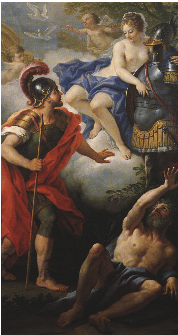
Fig. 10. Paolo de Matteis, Venere offre le armi ad Enea , Macerata, Galleria Buonaccorsi, da Barucca, Sfrappini 2001, p. 81