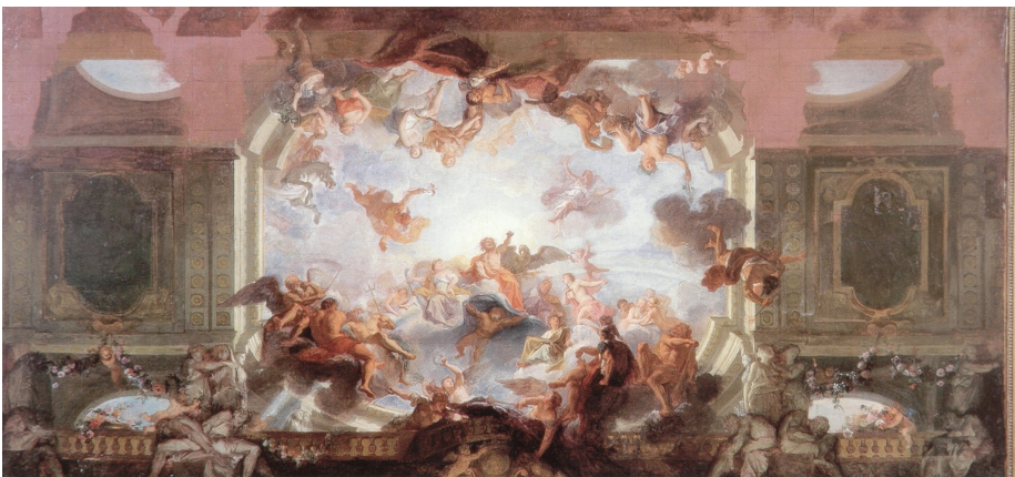
Fig. 5. Antoine Coypel, Bozzetto per la parte centrale della volta della Galerie d'Énée , 1702, Angers, Musée des Beaux-Arts, da Dominique Jarrassé, La peinture française au XVIII siècle , Paris 1998, p. 31