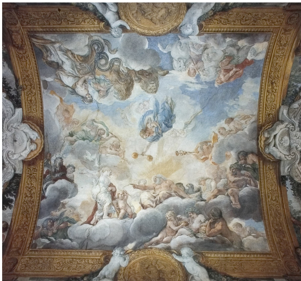
Fig. 6. Pietro Berrettini da Cortona, Parte centrale della volta della Galleria Pamphilj , 1651-1654, da http://romesweetromeguide.com/en/palace-pamphilj-gallery-secret-histories-aeneas/ , 22.05.2018