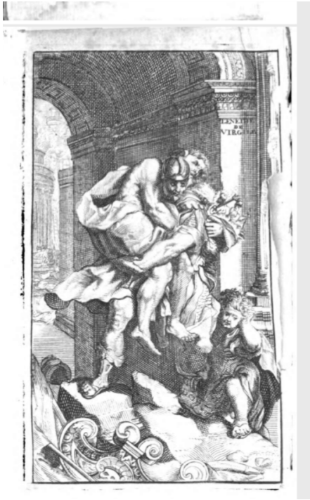
Fig. 3. Artista ignoto, La fuga d'Enea , incisione, da Segrais 1700, frontespizio