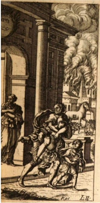
Fig. 7. Artista ignoto, Fuga d'Enea , incisione, da Stigliola 1699, vol. 1, p. 94