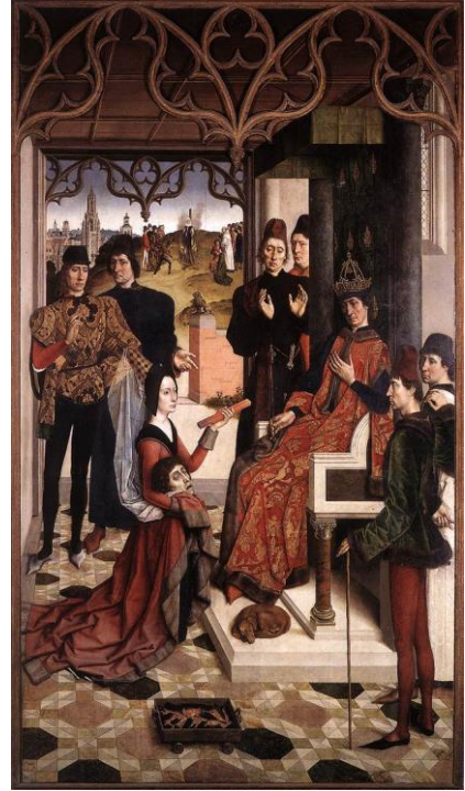
Fig. 5. Dieric Bouts, Il giudizio dell'imperatore Ottone (La prova del fuoco) , 1470 circa, Bruxelles, Musées Royaux des Beaux-Arts.