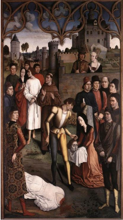
Fig. 4. Dieric Bouts, Il giudizio dell'imperatore Ottone (L'esecuzione del conte innocente) , 1470 circa, Bruxelles, Musées Royaux des Beaux-Arts.