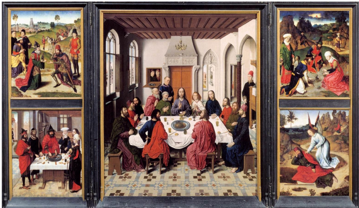
Fig. 1. Dieric Bouts, Trittico con l'Ultima Cena , 1464-1467, Lovanio, Collegiata di San Pietro