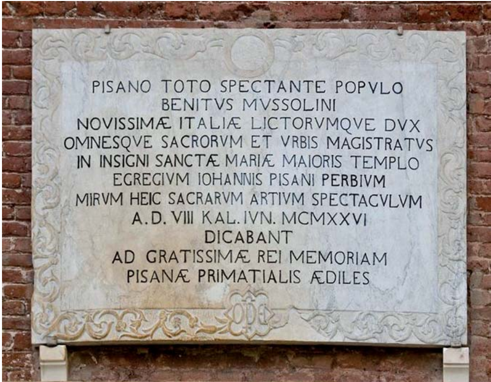
Fig. 7. Epigrafe posta sulla facciata degli uffici dell'Opera della Primaziale a ricordo dell'evento di inaugurazione del pergamo di Giovanni Pisano