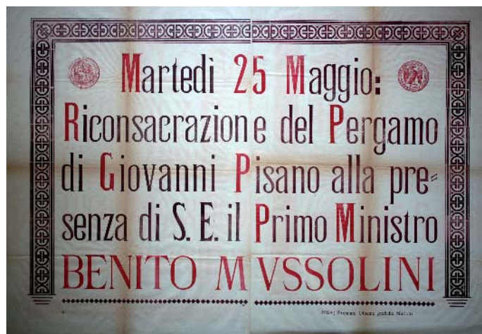
Fig. 3. Manifesto di Riconsacrazione del Pergamo di Giovanni Pisano alla presenza di S.E. il Primo Ministro Benito Mussolini, Pisa: Premiate Officine Grafiche Mariotti, Pisa: Archivio di Stato, Fondo Comune di Pisa- Postunitario, Serie VII, Busta 238, fascicolo n. 7, Monumenti ed Opere d'Arte, Carte non numerate