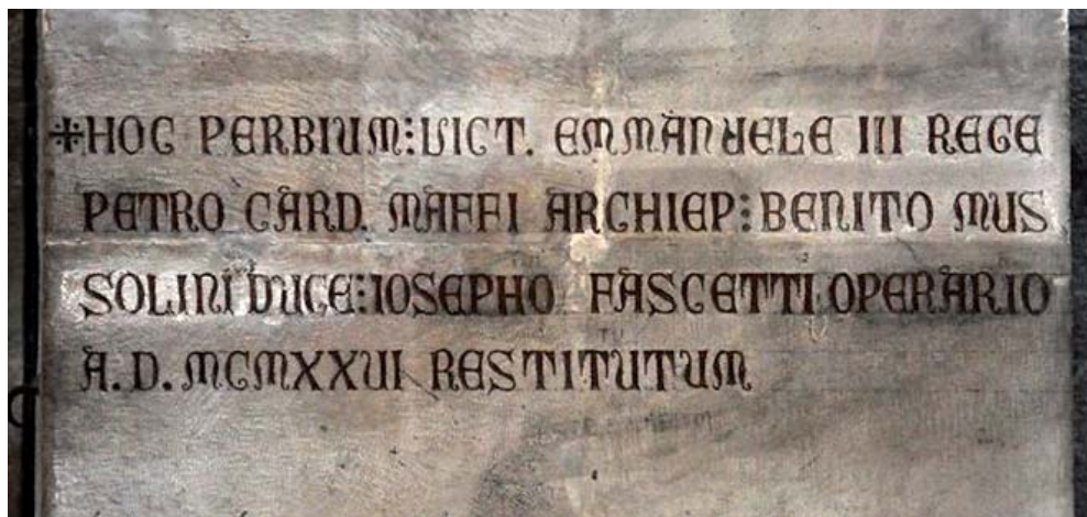
Fig. 4. Epigrafe posta sul pilastro adiacente al pulpito di Giovanni Pisano a ricordo dei 'committenti' dell'opera di ricomposizione