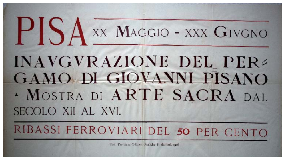
Fig. 5. Manifesto di Inaugurazione del Pergamo di Giovanni Pisano. Mostra di Arte Sacra dal secolo XII al XVI. Pisa: Premiate Officine Grafiche Mariotti, 1926, Pisa: Archivio di Stato, Fondo Comune di Pisa- Postunitario, Serie VII, Busta 238, fascicolo n. 7, Monumenti ed Opere d'Arte, Carte non numerate