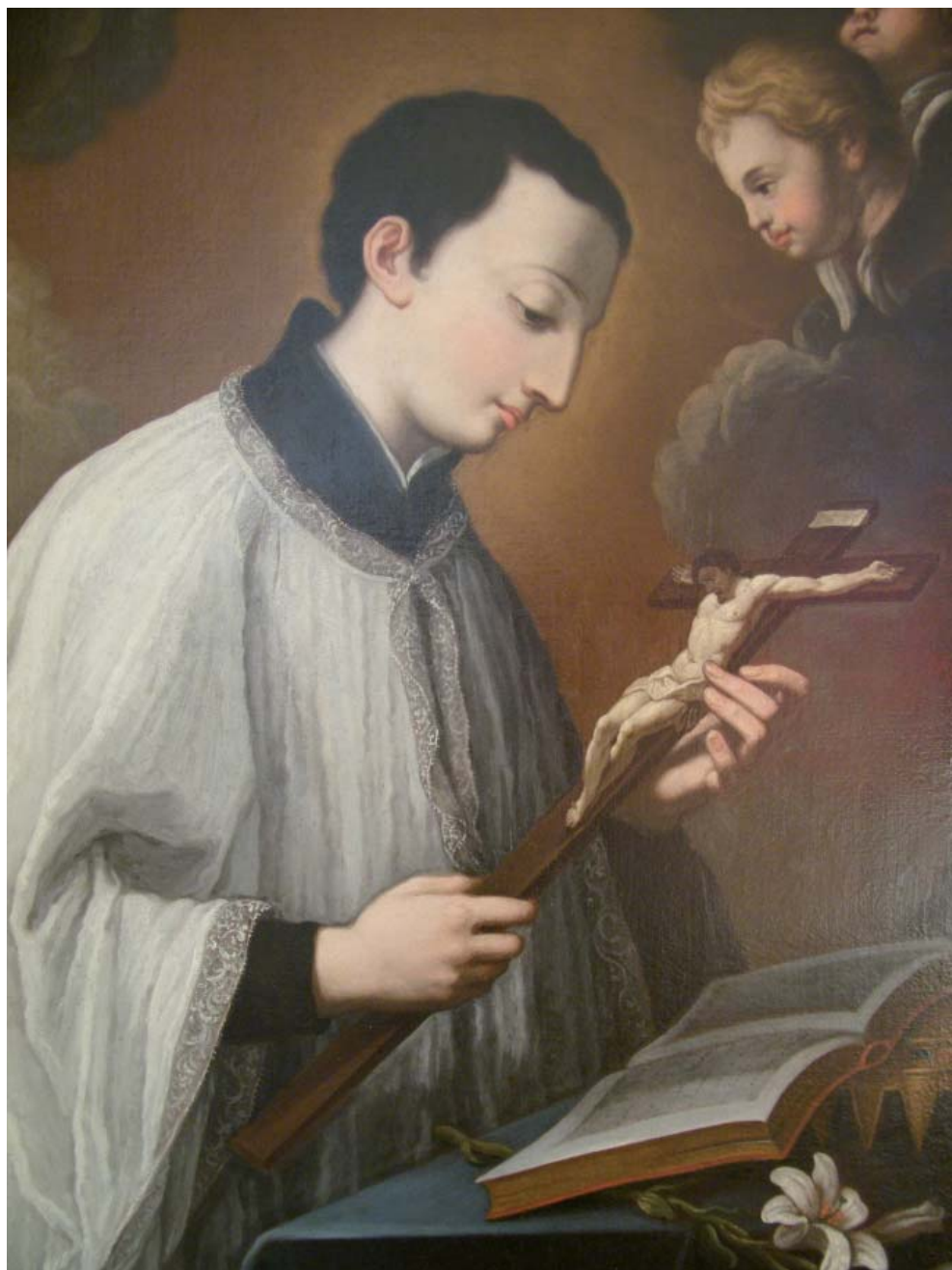
Fig. 11. Filippo Ricci, San Luigi Gonzaga , Fermo, monastero di Santa Chiara