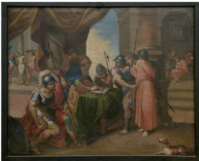
Fig. 8. Natale Ricci, prima Stazione della Via Crucis, Fermo, monastero di Santa Chiara