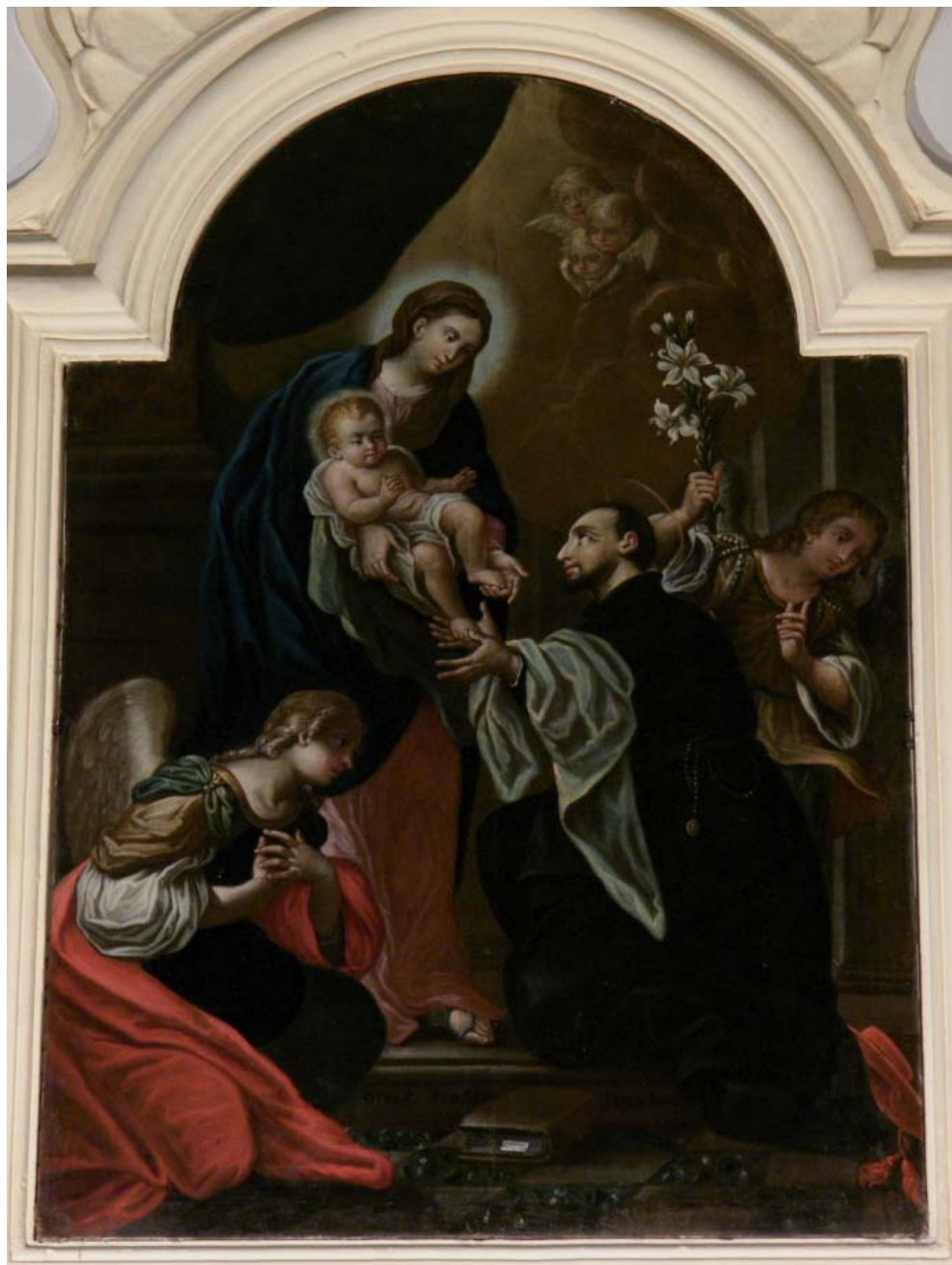
Fig. 12. Gilberto Todini, apparizione della Madonna col Bambino a san Gaetano da Thiene , Fermo, monastero di Santa Chiara