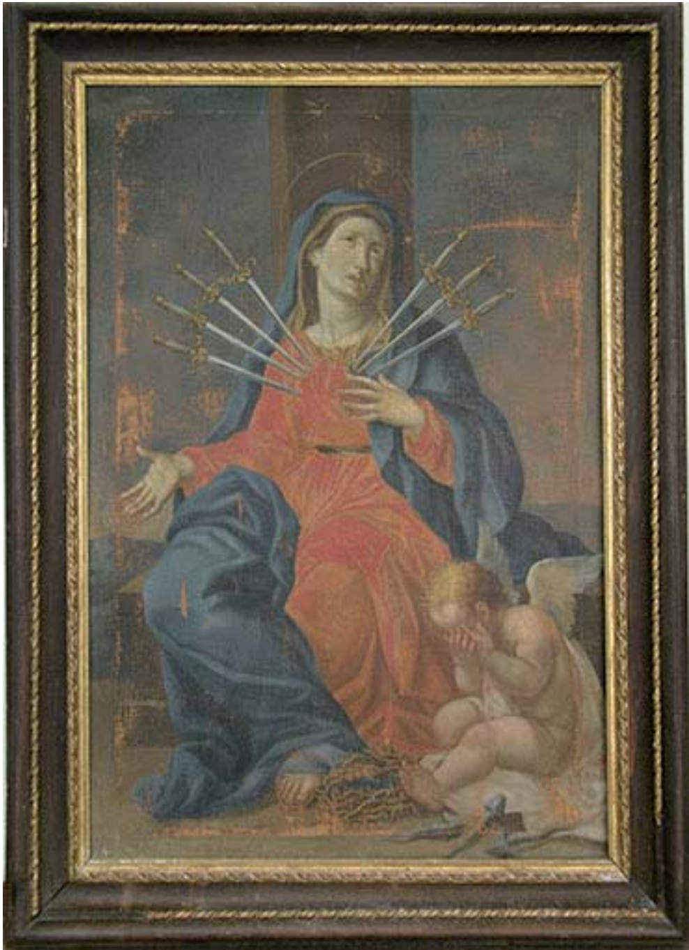
Fig. 5. Natale Ricci, Madonna Addolorata , Fermo, monastero di Santa Chiara