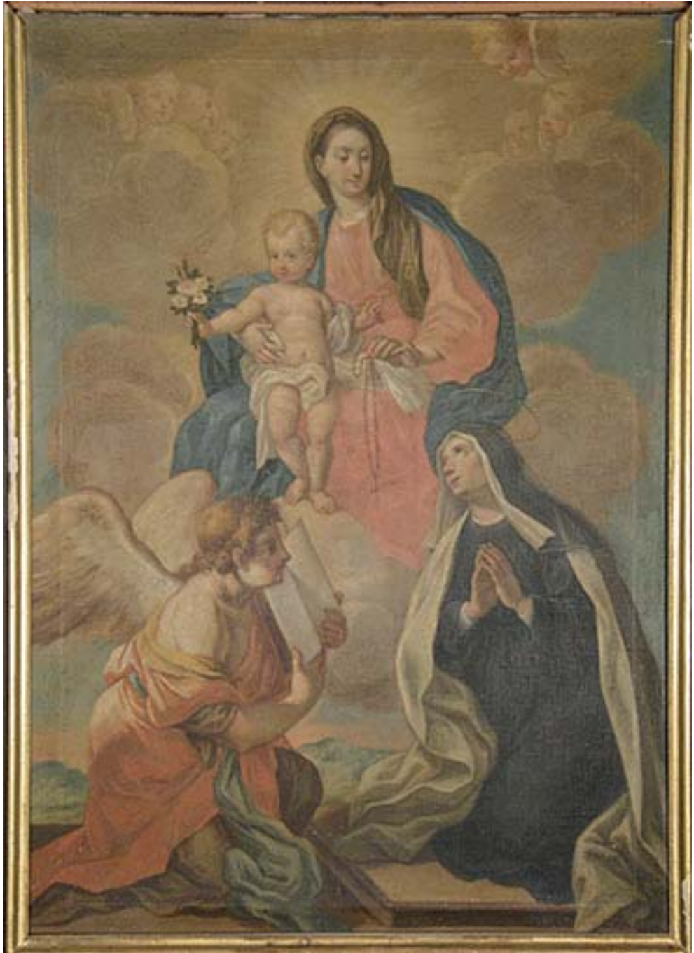
Fig. 3. Natale Ricci, Santa Rosa da Lima ha la visione della Madonna con Bambino in gloria e di un angelo , Fermo, monastero di Santa Chiara