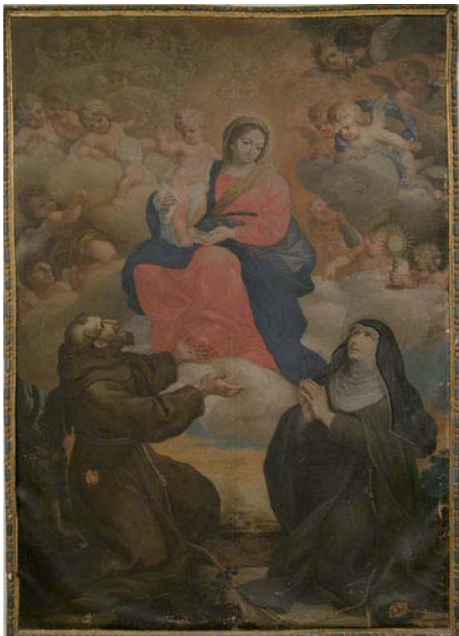
Fig. 2. Ubaldo Ricci, Madonna con Bambino in gloria con san Francesco d'Assisi e santa Chiara , Fermo, monastero di Santa Chiara