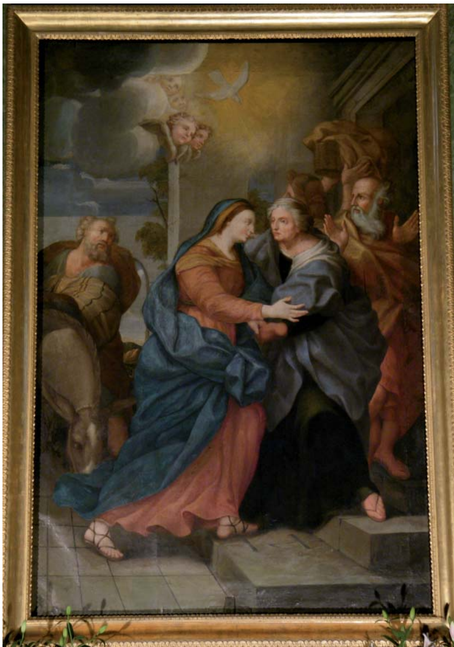
Fig. 1. Ubaldo Ricci, Visitazione di Maria a santa Elisabetta , Fermo, chiesa della Visitazione annessa al monastero di Santa Chiara