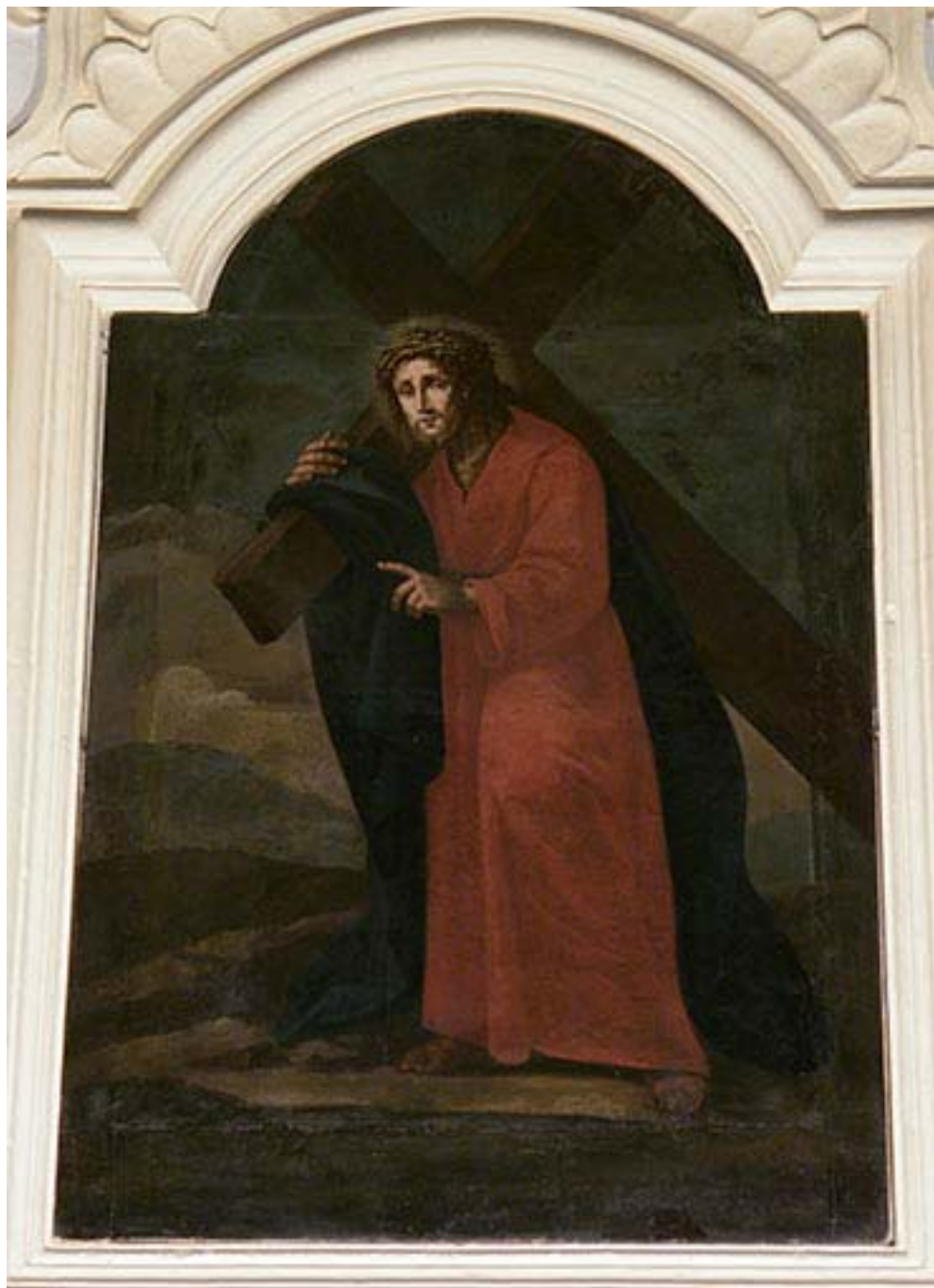
Fig. 10. Filippo Ricci, Cristo portacroce , Fermo, monastero di Santa Chiara