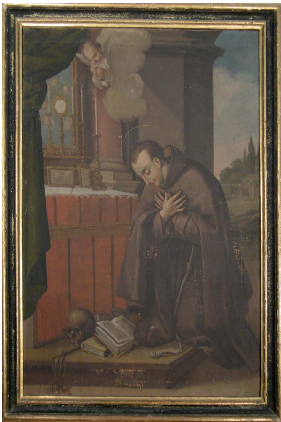
Fig. 9. Natale e Filippo Ricci, San Pasquale Baylon , Fermo, monastero di Santa Chiara