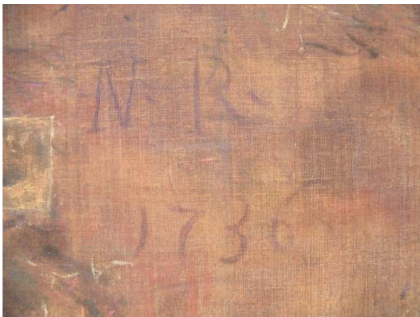
Fig. 7. Particolare della firma e della data sul verso del supporto della Madonna del Carmelo con san Simone Stock e santa Teresa d'Avila , Fermo, monastero di Santa Chiara